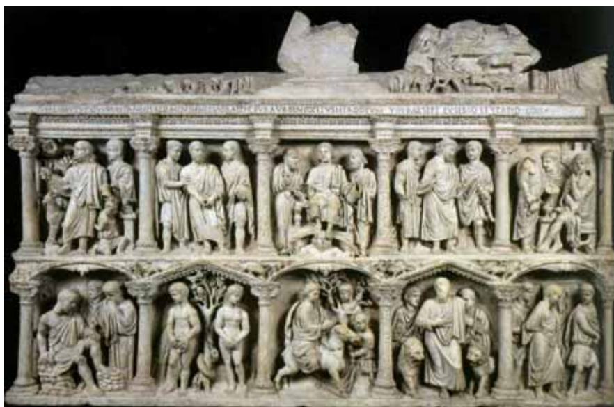
Ilustracja 4. Sarkofag Juniusza Bassusa. Dostęp 25 sierpnia 2018 < http://artbiblique.hautetfort.com/media/00/01/1330447912.jpg >