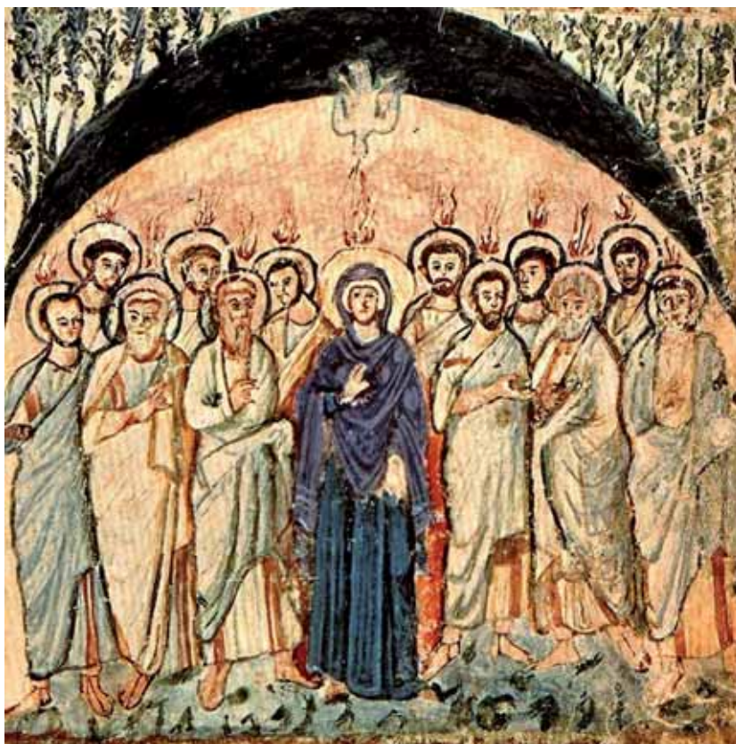
Ilustracja 1. Miniatura z Kodeksu Rabuli : Dostęp 25 sierpnia 2018. < http://poczta.kiwania.pl/wp-content/uploads/2018/03/800px-RabulaGospelsFolio14vPentecost.jpg >

kretyzuje dzieło Jezusa Chrystusa w świecie, a pięćdziesiątnica w tym kontekście jawi się, według metropolity Sawy, jako „ten akt Boży, który wynosi paschalne misterium Chrystusa w sferę wiecznie trwającego ‘teraz’. Wszystko [bowiem – J.S.], czego dokonuje Duch Święty wiąże się z wiecznie trwającym misterium Paschy Chrystusowej” (Metropolita Sawa i Baczyński 389). Duch Święty– Paraklet i zarazem Mądrość Boża jednoczy Kościół, a Jego obecność, symbolizowana przez rozdzielone i spoczywające oddzielnie na apostołach (w tym także na Matce Bożej) płomienie, wskazuje na różnorodność w Kościele (Leśniewski 119-120; o ikonografii Ducha Świętego: por. Cyrek 61) 1 .