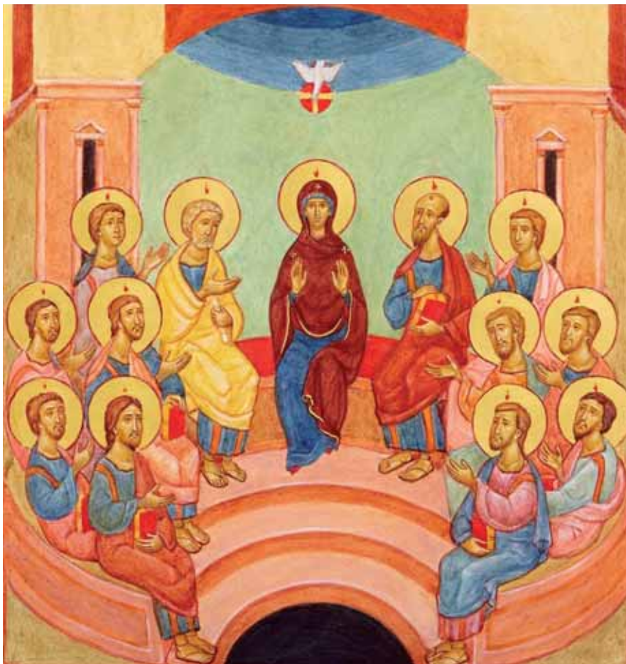
Ilustracja 2. Dostęp 25 sierpnia 2018 < http://pddm.pl/wp-content/uploads/2014/10/KRZYZ_9_Zeslanie_Ducha-B.jpg >

ska 92; Еремина 216) (por. il. 2) 5 . Owo puste, centralne miejsce przeznaczone jest dla niebiańskiego tronu ( hetojmazja , z gr. przygotowanie, gotowość), który symbolizuje paruzję i panowanie Jezusa Chrystusa, a także Jego majestat i sprawiedliwy sąd (por. miniatura z Psałterza Chludowskiego ) (Smykowska 30-31; Paprocki 30-34). Na temat obecności Matki Bożej w Wieczerniku pod-