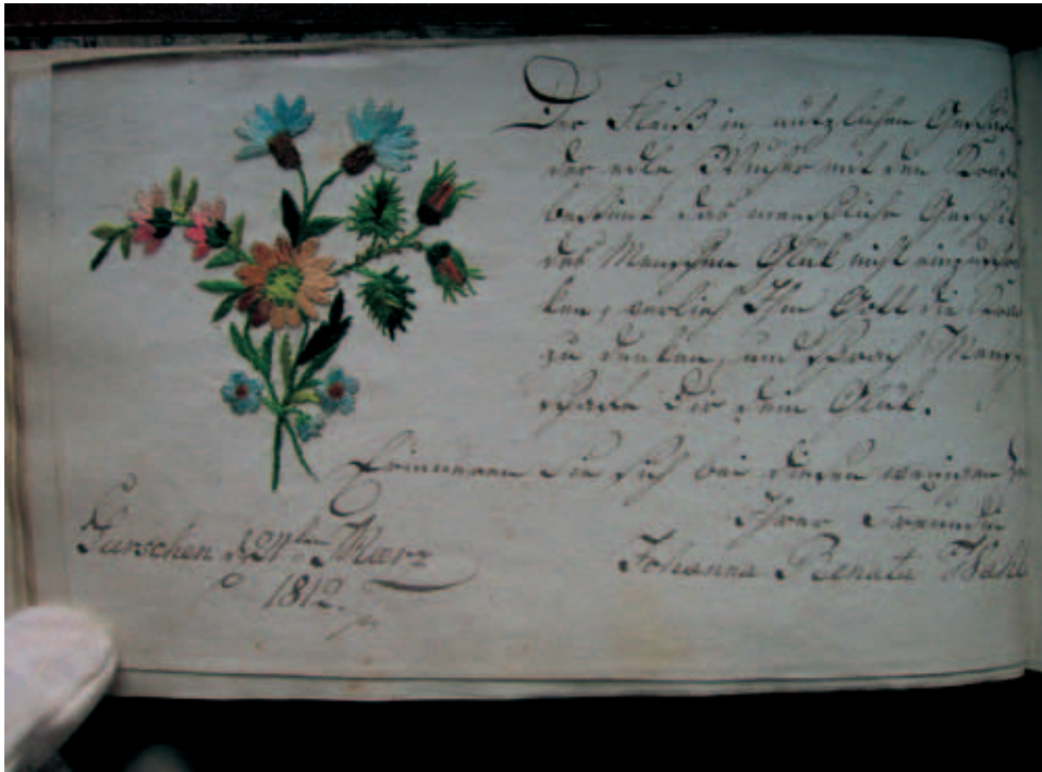
Fot. 2. Haft ze sztambucha Augusta Klemba

Kolejny haft zasługujący na szczególną uwagę (fot. 2 i 3) znajduje się w sztambuchu Augusta Klemba z Rawicza (rkp. 378 I).