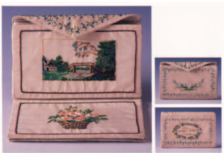
II. 3. Portfel z białej tafty z katalogu Torebki, sakiewki i portfele ze zbiorów Muzeum Narodowego w Krakowie (s. 291)