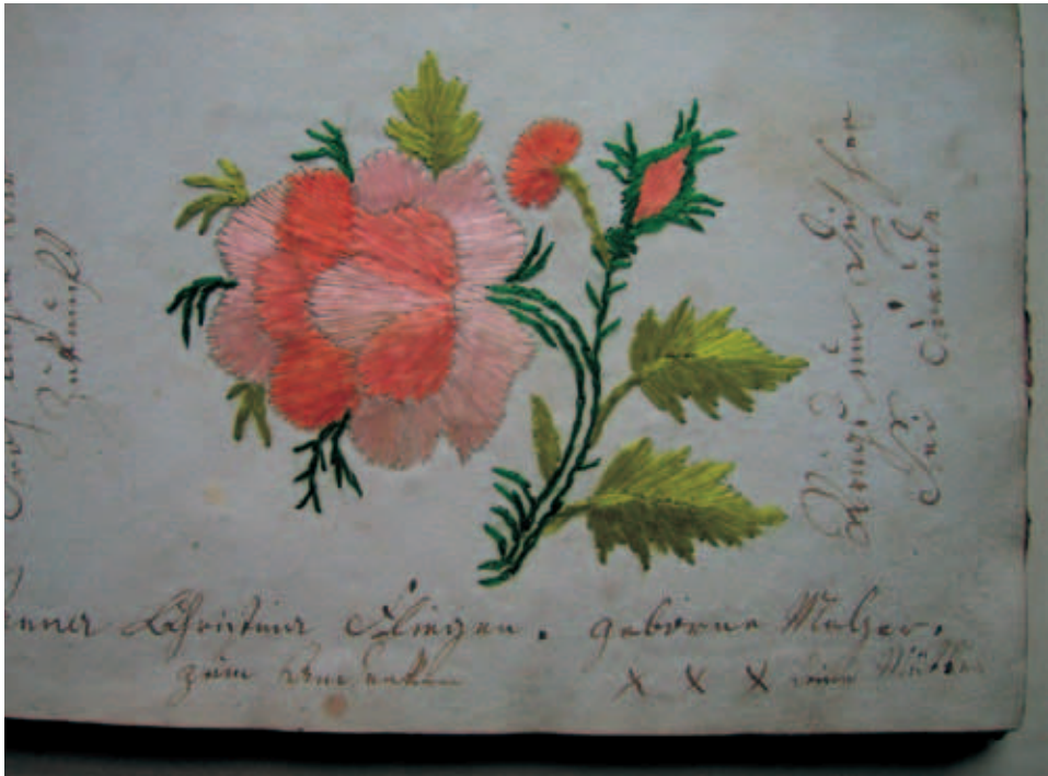
Fot. 5. Haft ze sztambucha G. Fliegego

pączki: rozwijający się oraz jeszcze zamknięty. Haft ten nie zachowuje proporcji rośliny, ale zawiera wiele drobnych elementów, które tworzą interesującą całość. Okalający wpis dał się odczytać jedynie fragmentarycznie: „Froh lächle Dir Zukunft” (Radośnie uśmiecha się do Ciebie przyszłość), a strofom wierszyka towarzyszy podpis: „Anna [...] zum Andenken” (Anna [...] na pamiątkę).