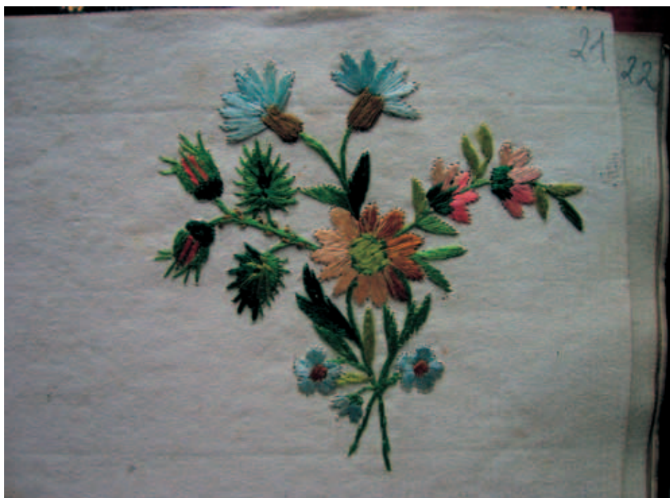
Fot. 3. Haft ze sztambucha Augusta Klemba

małym hafcie, w dodatku wykonanym na papierze, pozwala docenić sztukę autora.