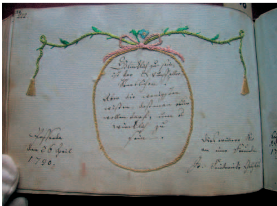
Fot. 1. Haft ze sztambucha Augusta Fiedlera

Widoczny na zdjęciu haft (fot. 1) 7 jest haftem dekoracyjnym, okalającym sztambuchowy wpis z roku 1790. Delikatne elementy kwiatowe i sznur, zakończony chwostami, wskazują wyraźnie na haft XVIII-wieczny w stylu Ludwika XVI 8 . „Silny naturalizm i rytmiczność coraz wyraźniej tu występują, linia falista wydłużona zaznacza swą przewagę” 9 . Zastosowane kolory są typowe dla haftów tej epoki: dominują zimne odcienie, takie jak bładoniebieski i blad różowy. Ze znajdujących się na karcie niewyraźnych wpisów łatwo rozszyfrować datę „den 26 April 1790” (26 kwietnia 1790) 10 .