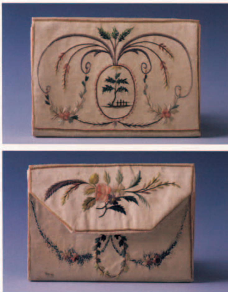
Il. 1. Portfel atlasowy z katalogu Torebki, sakiewki i portfele ze zbiorów Muzeum Narodowego w Krakowie (s. 276)

w wielu pracach. We Francji, w Anglii, w Holandii czy w Stanach Zjednoczonych zachowało się wiele zabytków świeckiego hafciarstwa amatorskiego w postaci na przykład samplerów, czyli wzorników 19 . Inaczej jest w Polsce: tu nie istnieją takie zabytki, które pozwoliłyby na porównanie użytych motywów i określenie jakiejś powtarzalności, czyli kopiowania raz użytych wzorów. Nie wiadomo też, czy wpłynęły na mniejszą lub większą popularność haftów. Postanowiłam więc porównać wykorzystane w sztambuchach wzory z innymi haftami polskimi z tego okresu.