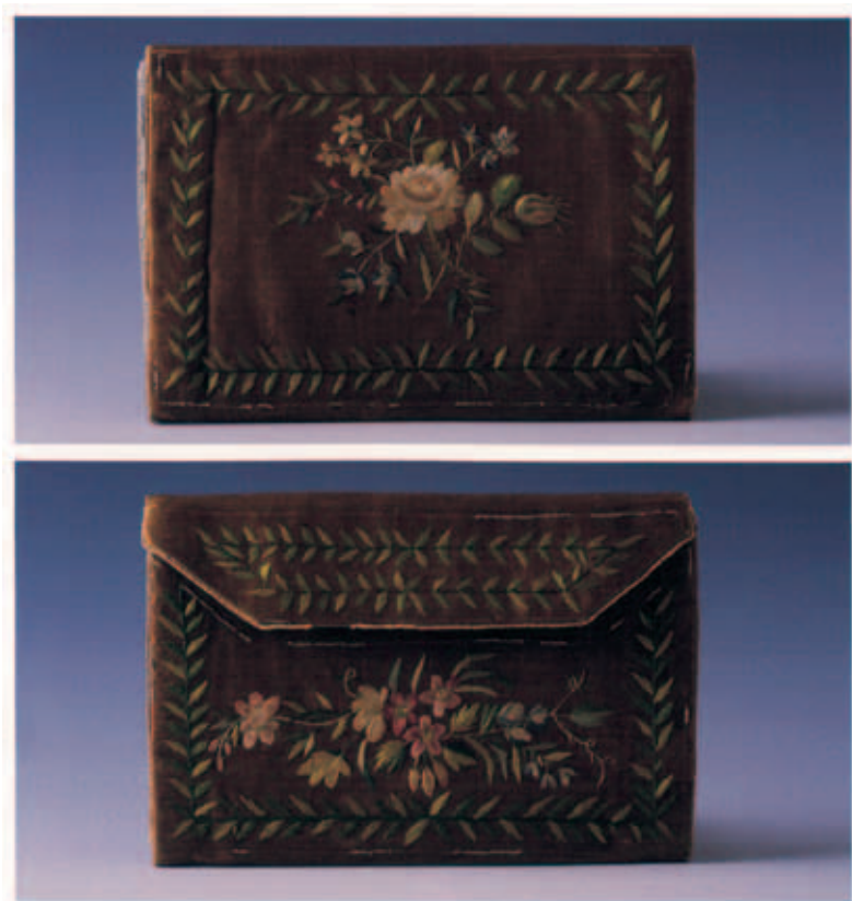
Il. 2. Portfel atlasowy na listy z katalogu Torebki, sakiewki i portfele ze zbiorów Muzeum Narodowego w Krakowie (s. 268)

Przykładem haftu kwiatowego – bardzo zbliżonego formą do haftu ze sztambucha Augusta Klemba z Rawicza (rkp. 378 I, fot. 2 i 3) – jest atlasowy portfel na listy z końca XVIII wieku (nr inw. MNK XIX-3525, il. 2), przedstawiający wiązanek kilku gatunków kwiatów.