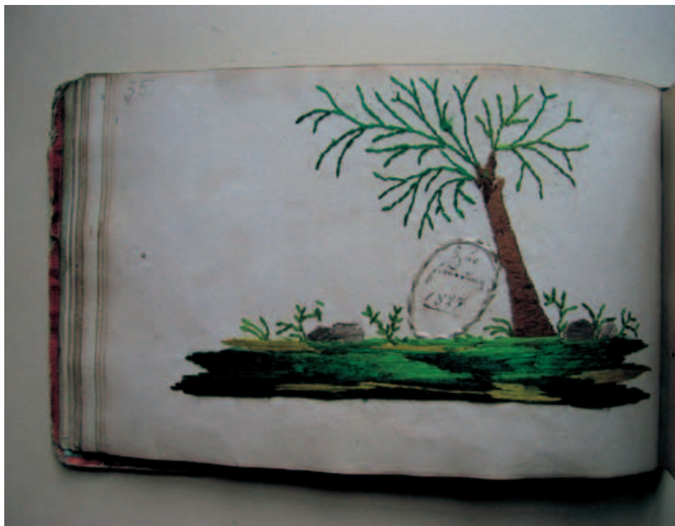
Fot. 7. Haft ze sztambucha G. Fliegego

czy też nakłuwano papier wcześniej, a w trakcie pracy koncepcja obrazu zmieniła się i pewne elementy pozostały niewykorzystane.