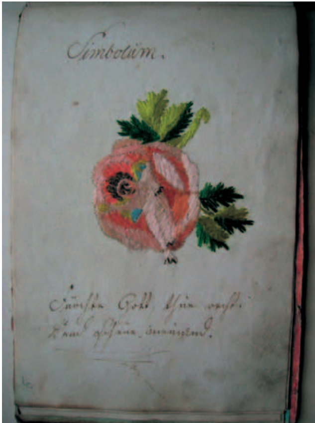
Fot. 4. Haft ze sztambucha G. Fliegego

ciekawym z uwagi na ilustracje wykonane farbą, a także kilka haftów 11 . Widoczne są tam cztery hafty. Trzy pierwsze to kwiaty wkomponowane w tekst, dwie róże i niebieski kwiat, być może niezapominajka. Kwiaty te nawiązują do tematyki roślinnej, popularnej w obu wymienionych stylach. Czwarty haft przedstawia fragment ogrodu.