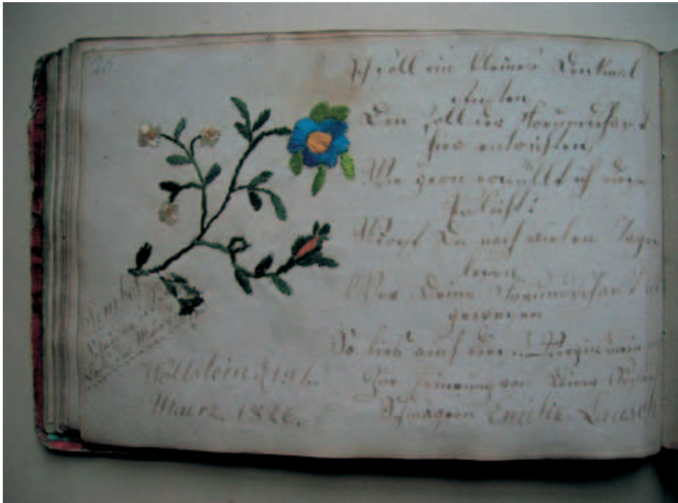
Fot. 6. Haft ze sztambucha G. Fliegego

na całej stronie, bez żadnych wpisów. Jedynie tablica oparta o drzewo zawiera notę: „Zur Erinnerung” (na pamiątkę) i datę „1827”.