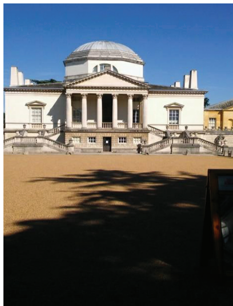
Fot. 5–6. Chiswick House

Wnętrza zostały zrekonstruowane wraz z piękną kolekcją mebli w stylu palladiańskim oraz wspaniałymi sufitami i wnękami. Każdy pokój reprezentuje inny żywioł, a także bogatą symbolikę wolnomularską. Pokój zielony ma przypominać o naturze i jej pięknie, pokój błękitny o sztuce i architekturze, pokój czerwony jest żywiołem ognia, a galeria odwołuje się do symboliki wodnej.