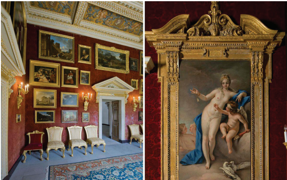
Fot. 10–11. Czerwony Aksamitny Pokój w Chiswick House

Tu mieścił się stół Williama Kenta, który zawierał wiele projektów architektów, takich jak Andrea Palladio, Inigo Jones, John Webb i Vincenzo Scamozzi. Sufit pomalowany przez Williama Kenta jest świadectwem zamiłowania lorda Burlingtona do architektury. W centrum przedstawia spersonifikowaną Architekturę i trzy aniołki, które chwytają narzędzia architektoniczne: poziomice i pion. Cały sufit otacza dekoracja, którą można interpretować jako przesłanie masońskie, narzędzia te były bowiem symbolami moralności. Aniołek po lewej stronie, jeden z muz Architektury, trzyma palec przy ustach, sugerując ciszę lub tajemnicę. Ściany wyłożone niebieskim aksamitem zawierają symbole cyrkla i węgelnicy.