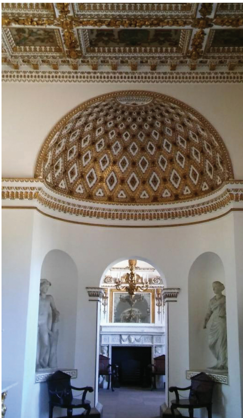
Fot. 12. Galeria w Chiswick House