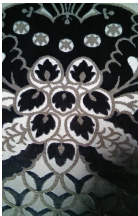
Fot. 7–9. Niebieski Aksamitny Pokój w Chiswick House