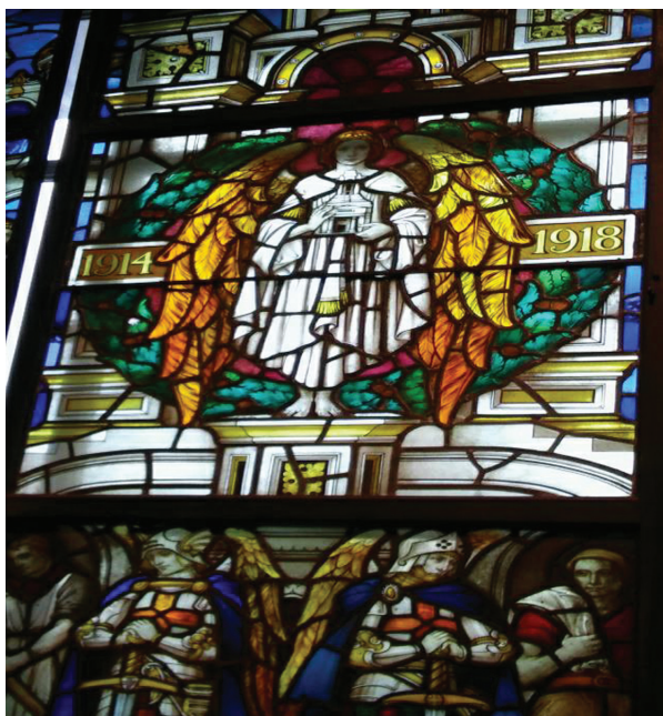
Fot. 1–2. Freemason's Hall