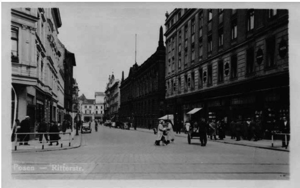
Ulica Ratajczaka (kartka z 22 marca 1941 roku)