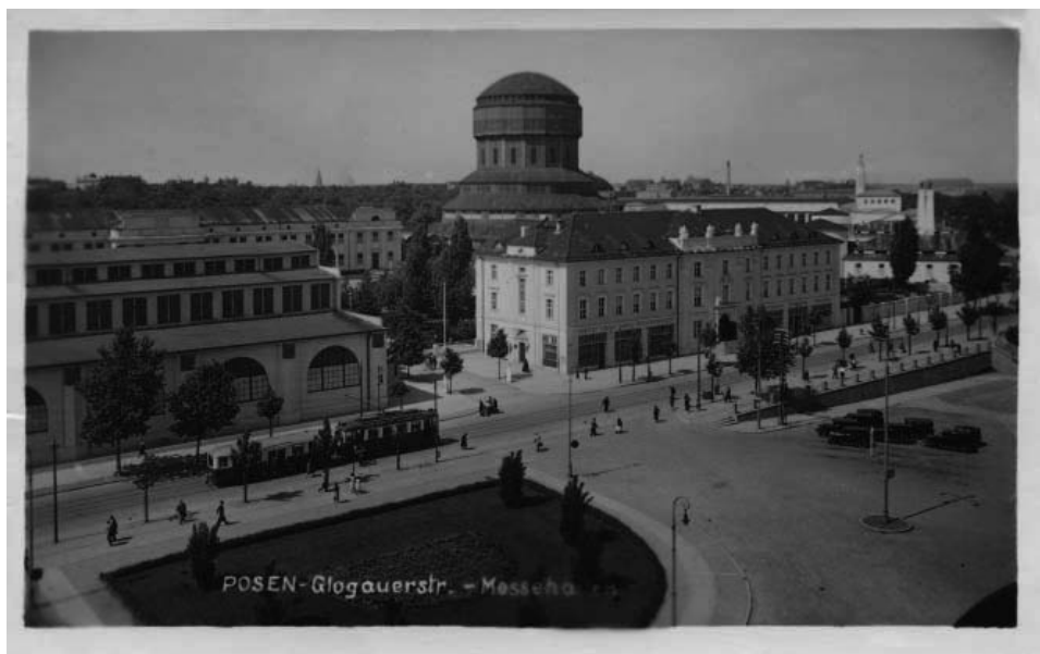
Ulica Głogowska na wysokości Targów (kartka z 21 kwietnia 1941 roku)

mat urodzin Führera w nawiązaniu do pogody tego dnia może świadczyć o tym, że nie bardzo wiedziały, jak zareagować na to święto, a uznała, że należy je odnotować.