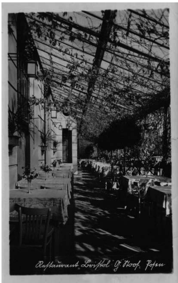
Restauracja „Bristol” (kartka z 2 września 1941 roku)

Wera wysyłała matce nie tylko żywność i rzeczy do wyprania lub przerobienia: