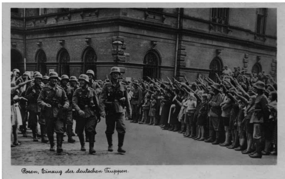
Wejście wojsk niemieckich do Poznania (kartka z 15 lipca 1942 roku)