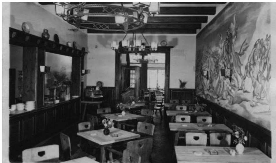
Karczma Rycerska (kartka z 25 lipca 1943 roku)

Poczuła ulgę, kiedy dwa dni później dostała list od matki: