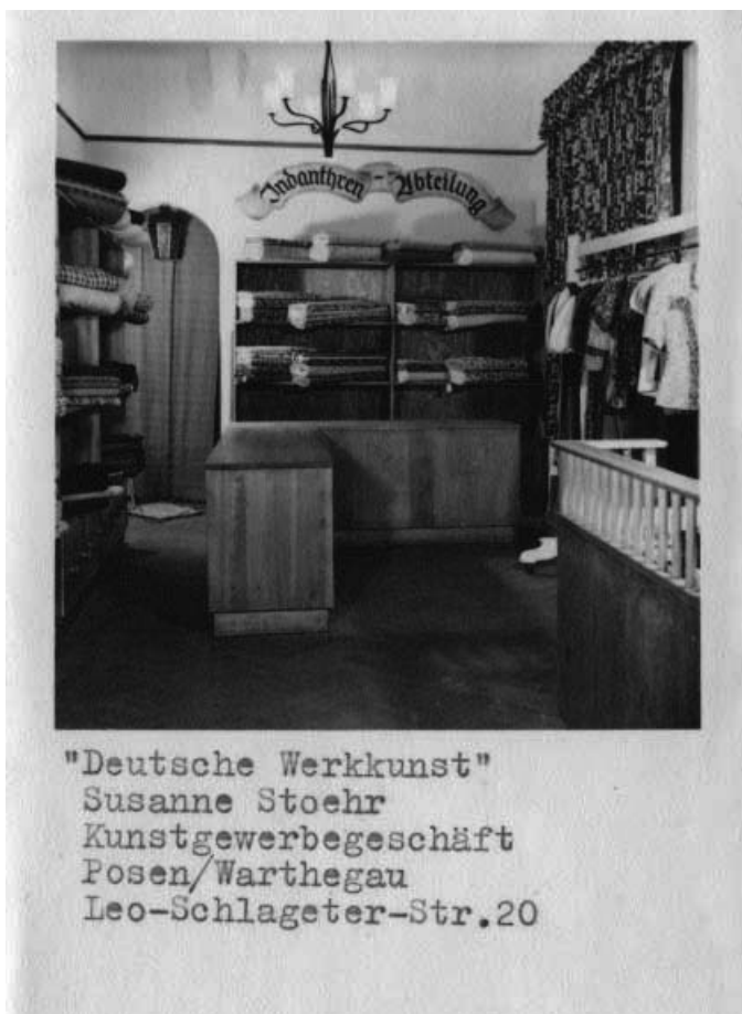
Sklep z rękodziełem – ul. Gwarna (kartka z 22 września 1943 roku)