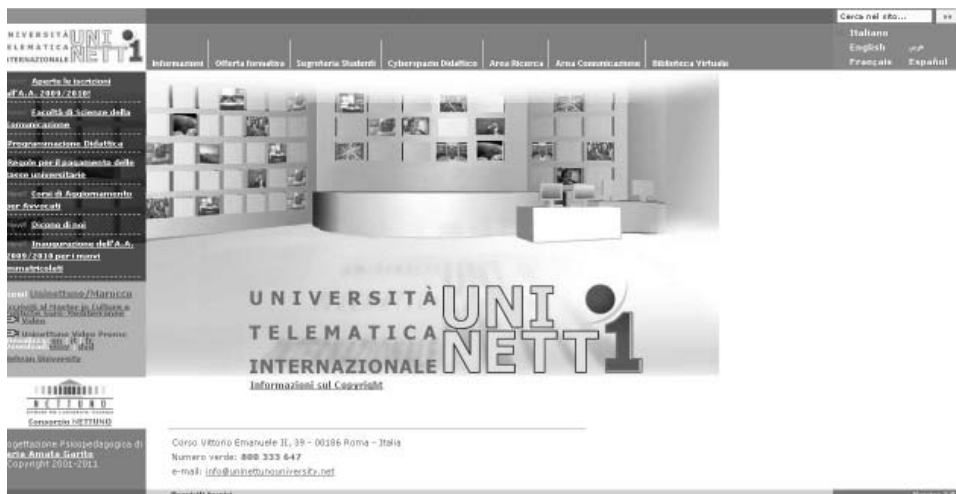
Il. 4. Strona główna uniwersytetu wirtualnego UNINETTUNO 17 . W lewym dolnym rogu widoczna ikona konsorcjum NETTUNO