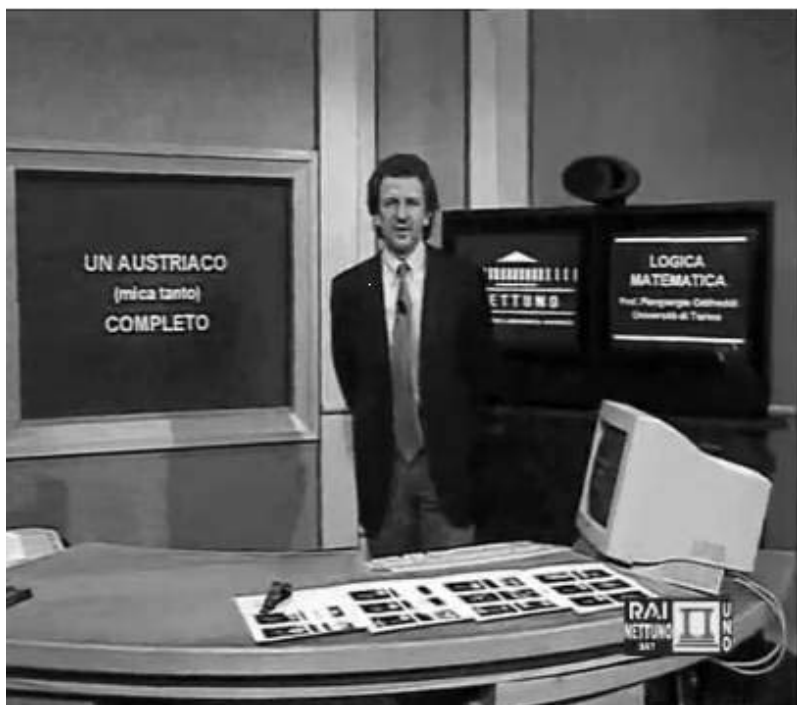
Il. 3. Przykład wykładu na Uniwersytecie NETTUNO 15

NETTUNO to największy z dotychczas zrealizowanych projektów tego typu w Europie i na świecie. Dzięki współpracy ministerstwa edukacji, wielu wyższych włoskich uczelni oraz innych instytucji i przedsiębiorstw powstał modelowy uniwersytet na odległość, który realizuje jeden z najważniejszych pomysłów Komisji Europejskiej, jakim jest stworzenie Europejskiego Wirtualnego Uniwersytetu w ramach projektów Med. Net'U (Mediterranean Network University) oraz LIVIUS (Learning In a Virtual University System) 16 . Ogromny sukces NETTUNO, jako modelowego uniwersytetu na odległość, wynika z zastosowania oryginalnego wzorca psychopedagogicznego oraz olbrzymiego wysiłku organizacyjnego, który pozwolił na wszechstronne wykorzystanie potencjału tkwiącego w najbardziej nowoczesnych i stale rozwijanych technologiach służących również edukacji.