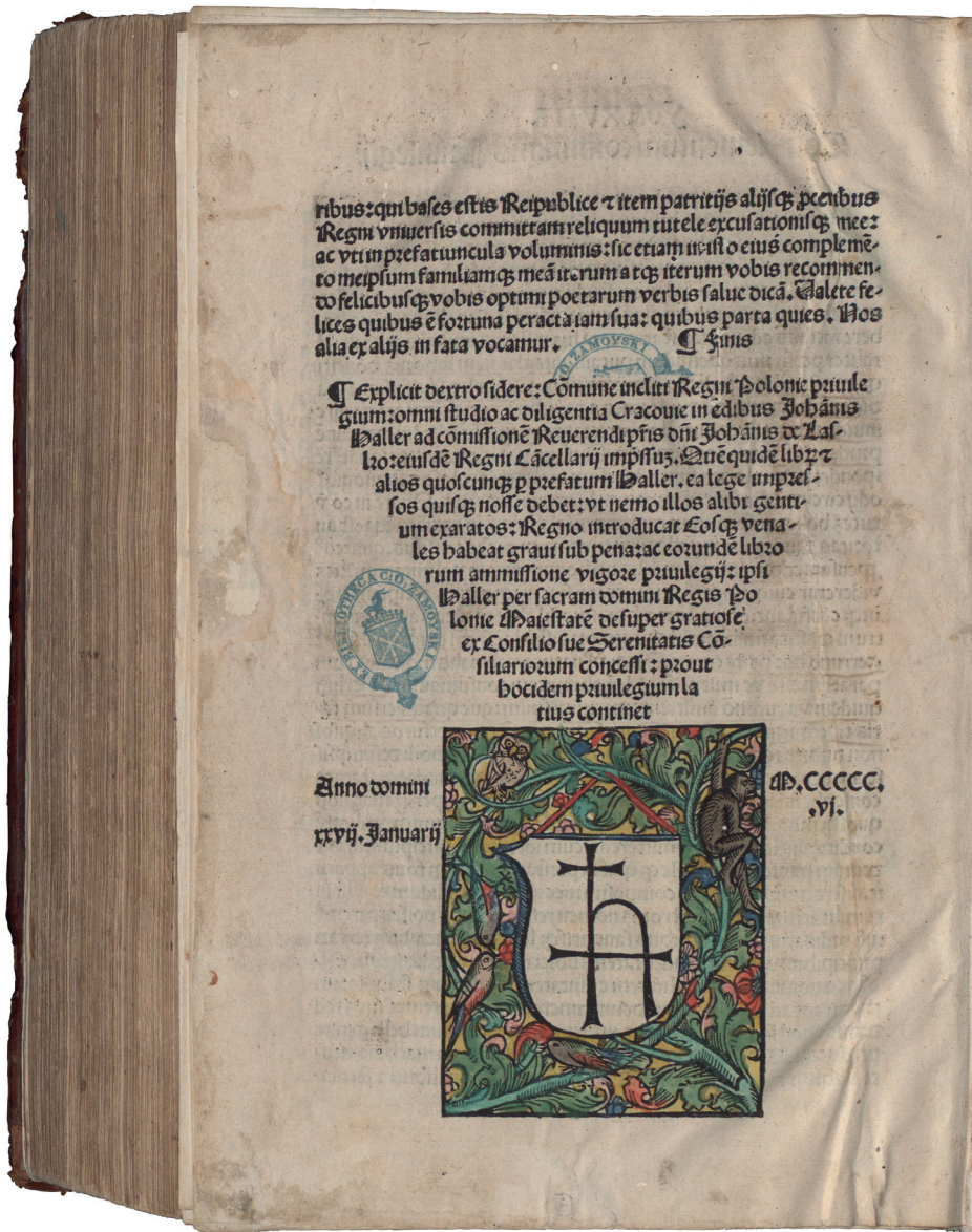
Il. 2. Kolofon w wariancie B. Biblioteka Narodowa, sygn. SD XVI.F.88