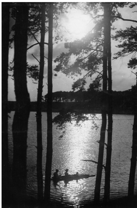
Il. 5. Wieczór nad Jeziorem Miejskim (Obywatelskim), ok. 1932 roku.