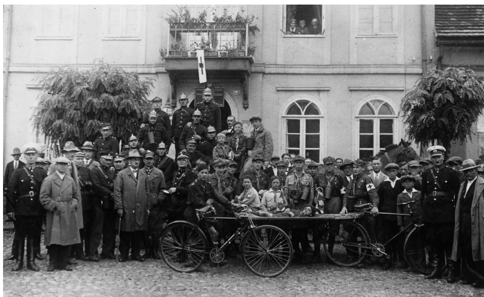
Il. 37. Pokaz gazowy LOPP, 7 lipca 1932 roku

później, 7 lipca, zorganizowano w mieście pokaz gazowy, z którego to wydarzenia burmistrz przesłał do komendanta powiatowego Przystosowania Wojskowego i Wychowania Fizycznego w Obornikach trzy zdjęcia 169 . W albumie znalazło się siedem fotografii z tego lipcowego dnia. Przedstawiają one płonące ognisko na rynku i gaszących je strażaków, harcerzy z noszami i wojskowych, niektórych w maskach gazowych. Na koniec wszyscy ustawili się do pamiątkowego zdjęcia (il. 37). Dwie fotografie dokumentują z kolei XIII Tydzień LOPP, którego obchody miały miejsce od 24 września do 1 października 1936 roku 170 . 27 września zorganizowano w Murowanej Goślinie loty propagandowe samolotem szkolnym RWD-8 – na jednym zdjęciu widać tłum stojący przed samolotem, na drugim miasto z lotu ptaka. Koło LOPP od 1933 roku działało także w miejscowej szkole powszechnej 171 . Uczniowie należący do tego koła – dziewczynki w opaskach pielęgniarских i chłopcy w maskach gazowych,