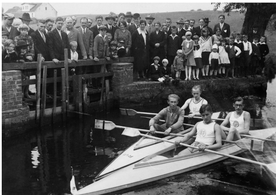
Il. 28. Poświęcenie kajaków członków Stowarzyszenia Młodzieży Polskiej Męskiej, 15 sierpnia 1931 roku

datę 28 czerwca skreślono i zapisano: 3 maja. Żadna z tych dat nie jest właściwa, ponieważ piątą rocznicę stowarzyszenie obchodziło 17 maja. Wątpliwości budzą też same zdjęcia. Przedstawiają one bowiem dużą uroczystość – przemarsz licznego pochodu przez rynek i ulicę Poznańską, poczty sztandarowe i defiladę. Znacznie bardziej pasują do dwóch innych zdjęć umieszczonych w albumie i podpisanych: „Zjazd okręgowy Stow. Młodz. Katol. 11/8.35”. Gwoli wyjaśnienia trzeba wspomnieć, że w 1934 roku Stowarzyszenie Młodzieży Polskiej zostało włączone w struktury Akcji Katolickiej i przekształcone w Katolickie Stowarzyszenie Młodzieży Męskiej (KSMM) 132 . Pod tą właśnie nazwą gośliński oddział KSMM gościł w niedzielę 11 sierpnia 1935 roku zlot VIII okręgu stowarzyszenia, tzw. okręgu Poznań-Północ. Jak informowało czasopismo „Młody Hufiec”, był to jeden z wielu zlotów zorganizowanych w sierpniu tego roku (inne odbyły się m.in. w Kościanie, Wronczynie, Jarocinie czy Dobrzycy). Wszystkie one „udały się wspaniale” i miały podobny przebieg: „Po rannej zbiórce i raporcie uczestnicy zlotu udawali się na nabożeństwo. [...] Po nabożeństwie – obowiązkowy przemarsz ulicami