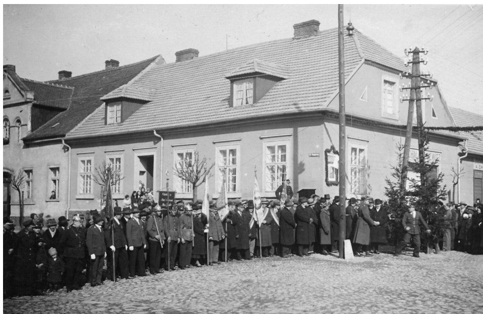
Il. 15. Delegacje towarzystw miejskich podczas uroczystości zmiany nazwy ulicy Rogozińskiej na ulicę Bronisława Pierackiego, 1935 rok