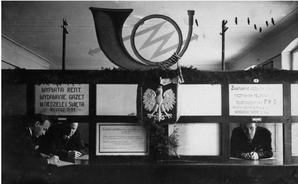
Il. 10. Okienka obsługi w pomieszczeniach nowego Urzędu Pocztaowo-Telegraficznego, 1936 rok