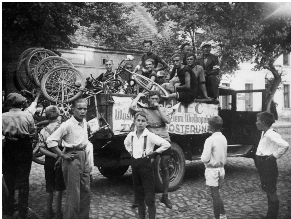
Il. 25. Wyścig kolarski „Dookoła Ziemi Wielkopolskiej”, 22 lipca 1934 roku

Do drugiego etapu (z Kościana) stanęło 56 zawodników, ostatecznie do mety dojechało 39 110 . Tych, którzy w trakcie zawodów rezygnowali, zabierało auto jadące na końcu peletonu. Właśnie samochód zamykający wyścig został uwieczniony na kilku fotografiach podczas postoju w Murowanej Goślinie (il. 25). Był on załadowany rowerami, siedzieli na nim kolarze, a z boku widniał napis: „KONIEC / Wyścigu Dookoła Ziemi Wielkopolskiej / ZWIJAĆ POSTERUNEK” 111 . Jeszcze dwa inne zdjęcia umieszczone w albumie dotyczą wyścigu. Jedno przedstawia przejeżdżającego przez gośliński rynek samotnego kolarza, któremu kibicuje grupa mieszkańców, a drugie – kolarzy wjeżdżających na metę na Stadionie Miejskim w Poznaniu.