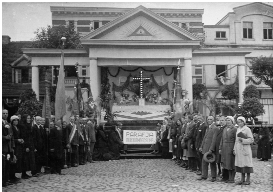
Il. 41. Parafianie z Murowanej Gośliny podczas XIII Zjazdu Katolickiego w Wągrowcu, 25 czerwca 1933 roku