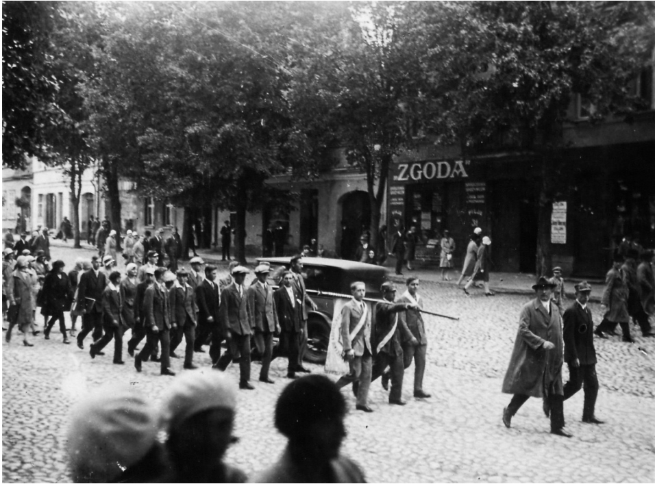
Il. 13. Stowarzyszenie Młodzieży Polskiej Męskiej w przemarszu ulicą Poznańską z okazji święta 10-lecia Cudu nad Wisłą, 1930 rok