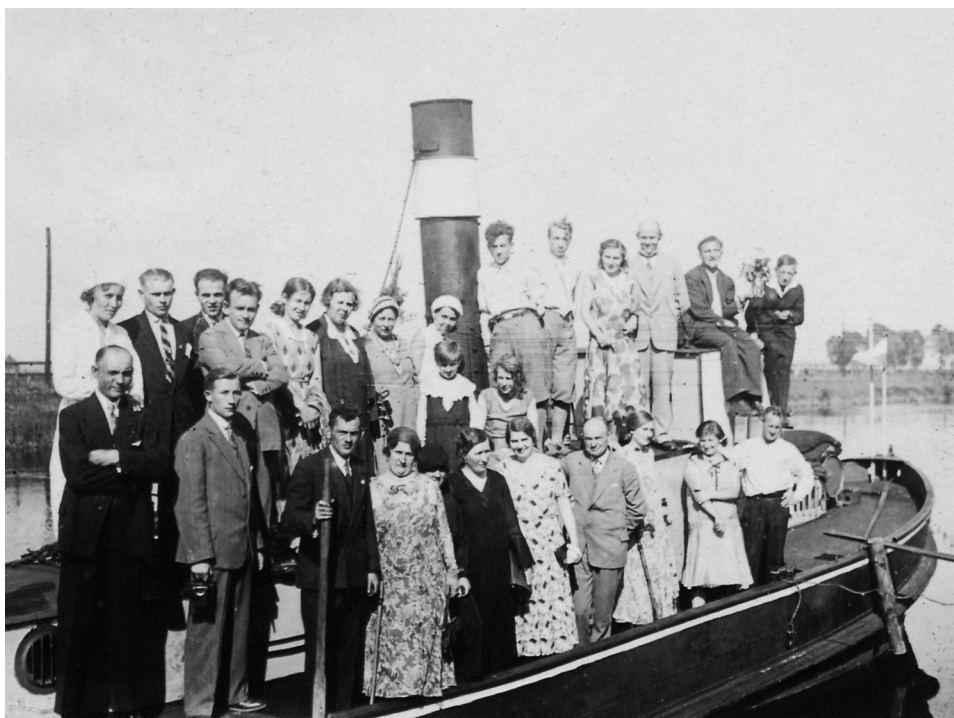
Il. 34. Wycieczka Stowarzyszenia Muzycznego „Harmonia” do Ujścia, 1931 rok