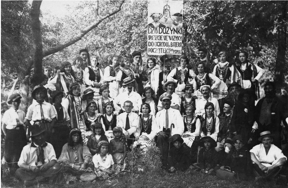
Il. 33. Uczestnicy dożynek, 28 sierpnia 1932 roku