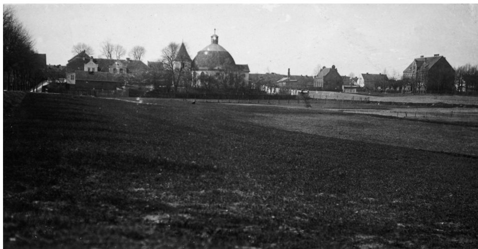
Il. 43. Widok na Murowaną Goślinę od strony dworca kolejowego, 1930 rok

W omawianym albumie znalazło się sześć zdjęć z 1945 roku podpisanych jako: „Wyzwolenie przez Armię Radziecką i Polską”, a przedstawiających ogrodzony drewnianym płotem prowizoryczny grób poległych Rosjan na goślińskim rynku oraz zniszczony w wyniku walk radziecki czołg przy jednej z dróg dojazdowych do miasta 198 .