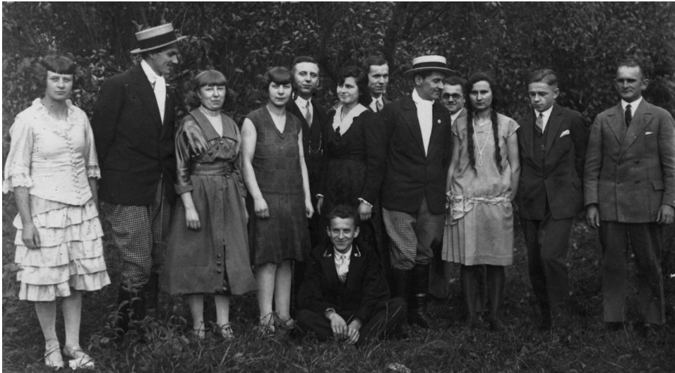
Il. 23. Aktorzy występujący w przedstawieniu Wicek i Wacek przygotowanym przez „Concordię”, 13 października 1929 roku

bliskich” 98 . Nie wiadomo, kto w przedstawieniu „Concordii” odgrywał role braci i czy dał popis zdolności scenicznych, ale na zachowanym zdjęciu dzięki charakterystycznym strojom obaj aktorzy wyróżniają się na tle innych (il. 23). Członkowie klubu organizowali także letnie zabawy, np. 9 sierpnia 1931 roku na polanie leśnej przy Boduszewie urządzili „zabawę latową, połączoną z różnymi niespodziankami”, do której przygrywała orkiestra „Harmonii” 99 .