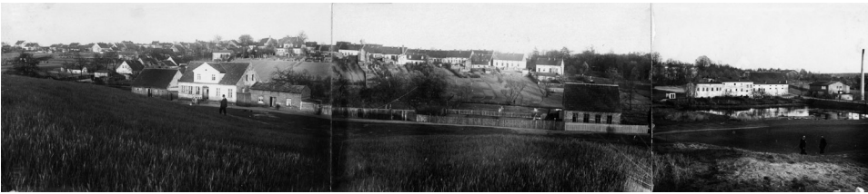
Il. 1. Panorama Murowanej Gośliny z zachodu

W albumie znajduje się kilka fotografii z widokami ogólnymi miasta. Jednym z nich jest panorama Murowanej Gośliny z zachodu (il. 1), złożona z trzech fotografii, datowana na 1930 rok. W tle widać gęstą zabudowę śródmieścia, na pierwszym planie budynki ulicy Spokojnej, a z prawej strony młyn wodny ze stawem i budynki dawnej gorzelnii.