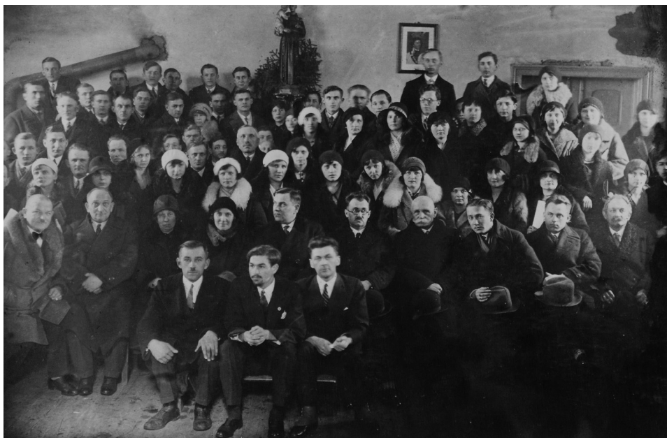
Il. 32. Zebranie z okazji 5-lecia Towarzystwa Chóru Kościelnego, 15 marca 1931 roku