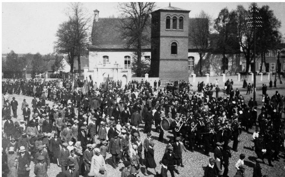
Il. 12. Obchody święta uchwalenia Konstytucji 3 maja, 1930 rok