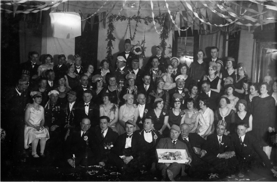
Il. 17. Bal królewski Bractwa Strzelców Kurkowych, 2 marca 1930 roku

i wypoczynku mieszkańców, dlatego dbano o niego szczególnie, sadzono drzewa, żywopłoty, wytyczano alejki spacerowe.