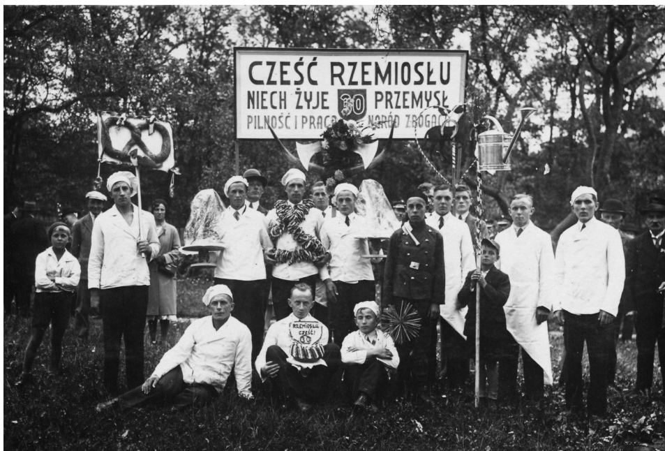
Il. 21. Uroczystości 30-lecia istnienia Towarzystwa Przemysłowego, 1934 rok