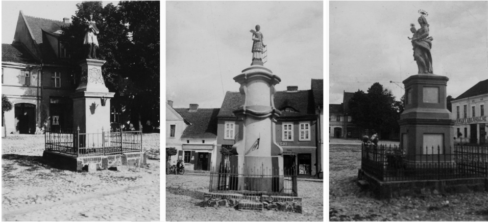
Il. 3, 3a, 3b. Pomniki z figurami św. Jana Nepomucena, św. Wawrzyńca i Matki Boskiej z Dzieciątkiem zdobiące gośliński rynek do 1939 roku