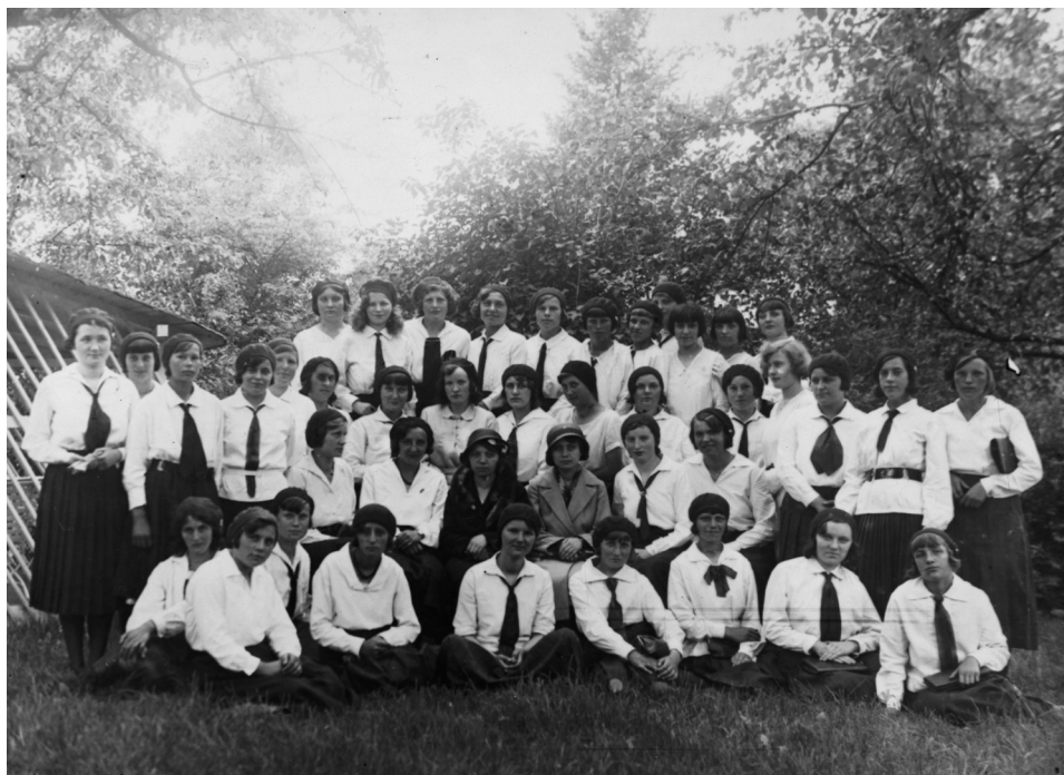
Il. 30. Stowarzyszenie Młodych Polek, 1933 rok