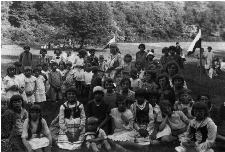
Il. 11. Dzień Dziecka, 1931 rok

w innych latach, co potwierdzają zdjęcia z albumu. Te podpisane jako „Dzień Dziecka 1931” (il. 11) uchwyciły dzieci w trakcie zabawy w lesie i siedzące na polanie (zabawa odbyła się wówczas w parku leżącym tuż obok Murowanej Gośliny, w Przebędowie) 35 , te z 1936 roku ukazują pochód przez miasto (zabawę zorganizowano wówczas 21 czerwca i „mimo burzy dzieci w towarzystwie rodziców i p.p. nauczycieli spędziły miłe chwile” 36 ). Z kolei 28 kwietnia 1934 roku szkoły z Murowanej Gośliny i okolic, przy wsparciu Nadleśnictwa Państwowego Zielonka, urządziły tzw. Święto Lasu 37 . W programie znalazły się: nabożeństwo, pochód do lasu w Rakowni, przemówienia okolicznościowe, śpiewy, sadzenie