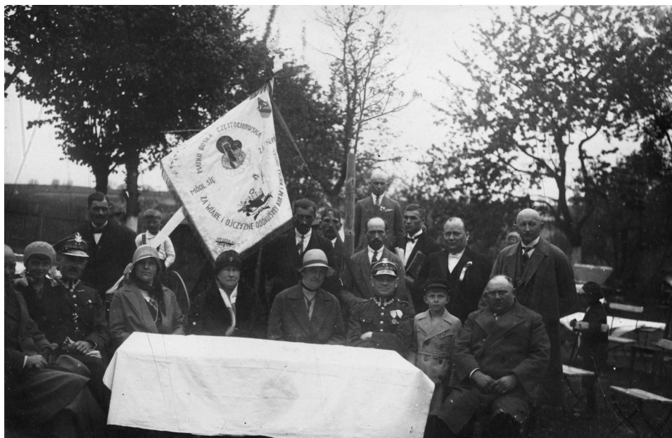
Il. 22. Uroczystość poświęcenia sztandaru Związku Inwalidów Wojennych, 11 maja 1930 roku

się na sztandar dla naszej grupy” 87 . Uroczystość jego poświęcenia, zgodnie z podpisami pod zdjęciami w albumie, odbyła się 11 maja 1930 roku i obejmowała m.in. pochód ulicami miasta. Uczestników wydarzenia utrwalono na kilku fotografiach zbiorowych. Na jednej z nich doskonale widać na sztandarze napis („Matko Boska Częstochowska / Módl się za nami / Za wiarę i ojczyznę oddaliśmy krew i kości nasze”) oraz herb Murowanej Gośliny (il. 22).