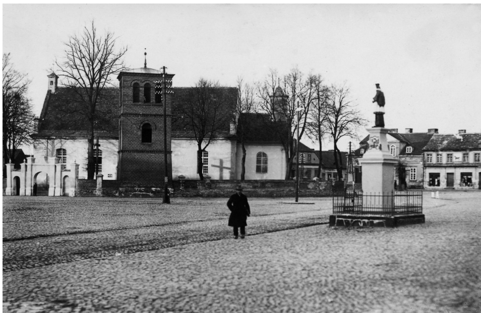
Il. 2. Rynek z figurą św. Jana Nepomucena oraz kościołem katolickim z dzwonnica i murem otaczającym świątynię

na nim był kościół katolicki (il. 2) pw. św. Jakuba Apostoła, który wraz z towarzyszącą mu murowaną dzwonnica ogrodzony był murem z prowadzącymi do niego dwoma bramami. W albumie znalazło się wiele zdjęć z gmachem kościoła widocznym albo na pierwszym planie, albo nieco w tle oraz kilka ukazujących jego wnętrze. Na tych ostatnich wiadać ołtarz główny z obrazem siedzącego na tronie św. Jakuba i rzeźbami św. św. Piotra i Pawła oraz ołtarze boczne, w tym lewy z obrazem Matki Boskiej z Dzieciątkiem w srebrnej sukience 6 .