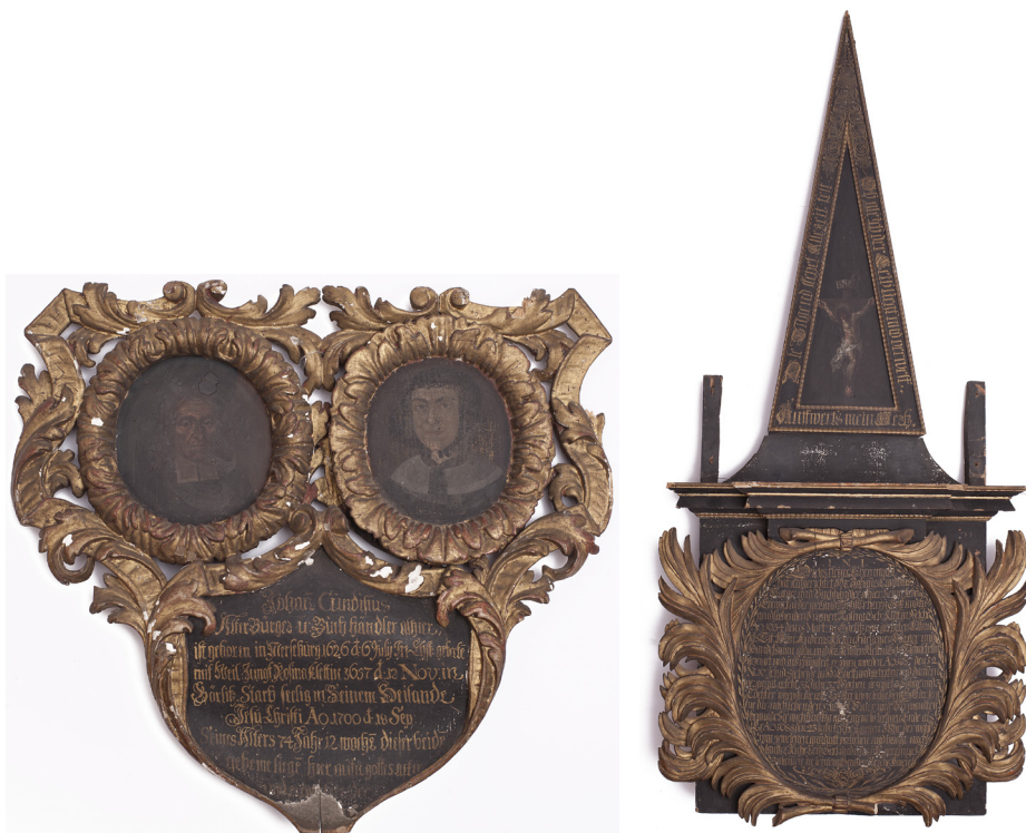
Il. 1a–b. Epitafium rodziny Cundisiusów

Źródło: Muzeum Ziemi Wschowskiej, nr inw. MZW/Dep/110. Fot. Dawid Gąsiorek.