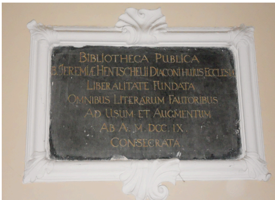
Il. 1. Tablica nad drzwiami biblioteki w kościele św. Krzyża w Lesznie