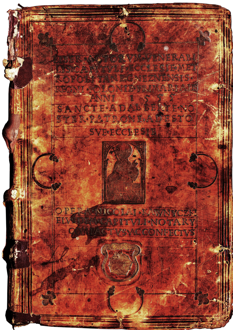
Il. 15. Oprawa protokołów posiedzeń gnieźnieńskiej kapituły metropolitalnej (górna okładzina), Jan Targoyń, Poznań