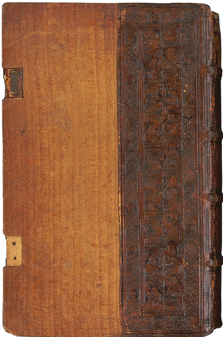
Il. 14. Oprawa starego druku (dolna okładzina), Jan Targoyń, Poznań