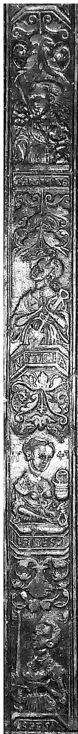
Il. 8. Wycisk radełka na oprawie starego druku, Jan Targoyn, Poznań