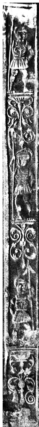
Il. 11. Wycisk radełka na oprawie staro- rego druku, Jan Targoyn, Poznań