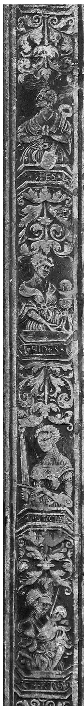
Il. 9. Wycisk radełka na oprawie starego druku, Jan Targoyn, Poznań