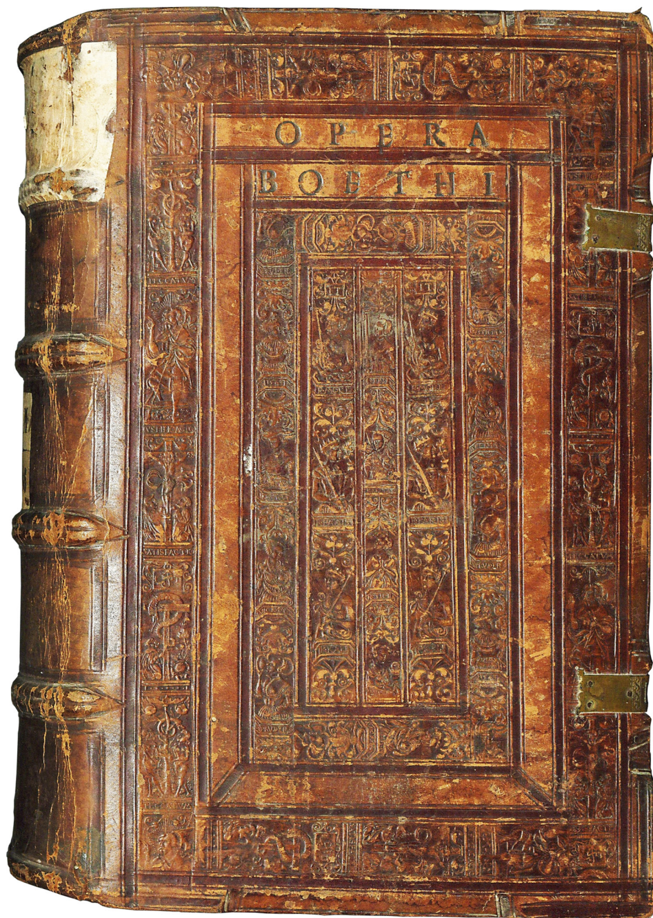
Il. 12. Oprawa starego druku (górná okładzina), Jan Targoyń, Poznań