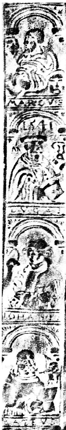
Il. 5. Przerys ołówkowy wycisku radełka na oprawie starego druku, Jan Targoyń, Poznań