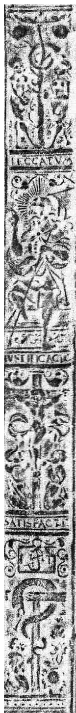
Il. 1. Przerys ołówkowy wycisku radełka na oprawie starego druku, Jan Targoyń, Poznań