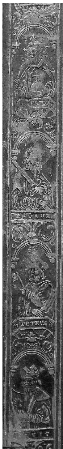
Il. 6. Wycisk radełka na oprawie starego druku, Jan Targoyń, Poznań