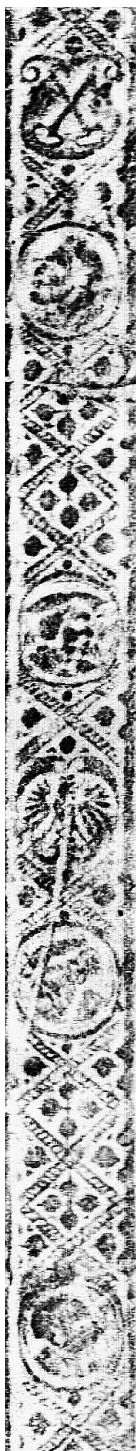
Il. 3. Przerys ołówkowy wycisku radełka na oprawie starego druku, Jan Targoyń, Poznań