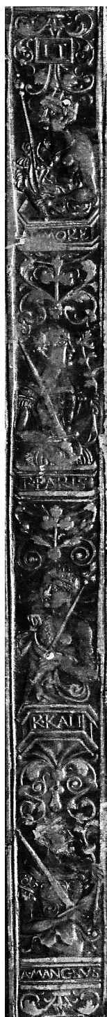
Il. 2. Wycisk radełka na oprawie starego druku, Jan Targoyń, Poznań