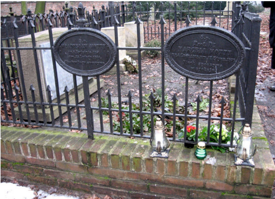
Il. 3. Grób rodziny Mottych na Cmentarzu Zasłużonych na Wzgórzu Świętego Wojciecha w Poznaniu

Zmarł 17 stycznia 1898 roku. Jego pogrzeb zmienił się w manifestację społeczeństwa poznańskiego licznie przybyłego, by pożegnać wspaniałego człowieka, nauczyciela oraz znawcę i miłośnika swej epoki. Po latach, w 1981 roku Koło Przewodników PTTK w Poznaniu wybrało Marcelego Mottego na swego patrona i do dziś w różnorodny sposób kultywuje jego pamięć i dokonania 7 .