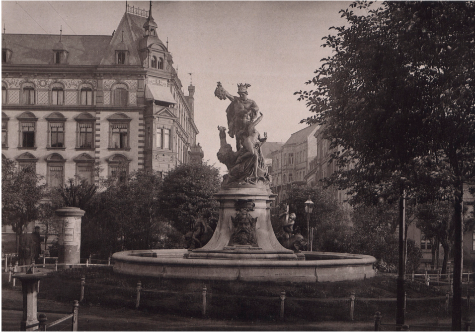
Il. 11. Plac Królewski (dziś pl. Cyryła Ratajskiego) – fotografia Józefa Engelmana z około 1890 roku z albumu Kunstverein Posen Źródło: zbiory Biblioteki Uniwersyteckiej w Poznaniu.

obyczajowych interesujące dla Mottego okazują się np. dzieje stosowania tabaki i tytoniu, od których zapewne, śladem swego ojca, nie stronił, czy – niewątpliwie intrygujący – wynalazek dagerotypu (fotografii), na którego temat pozostawił szeroki wywód 77 .