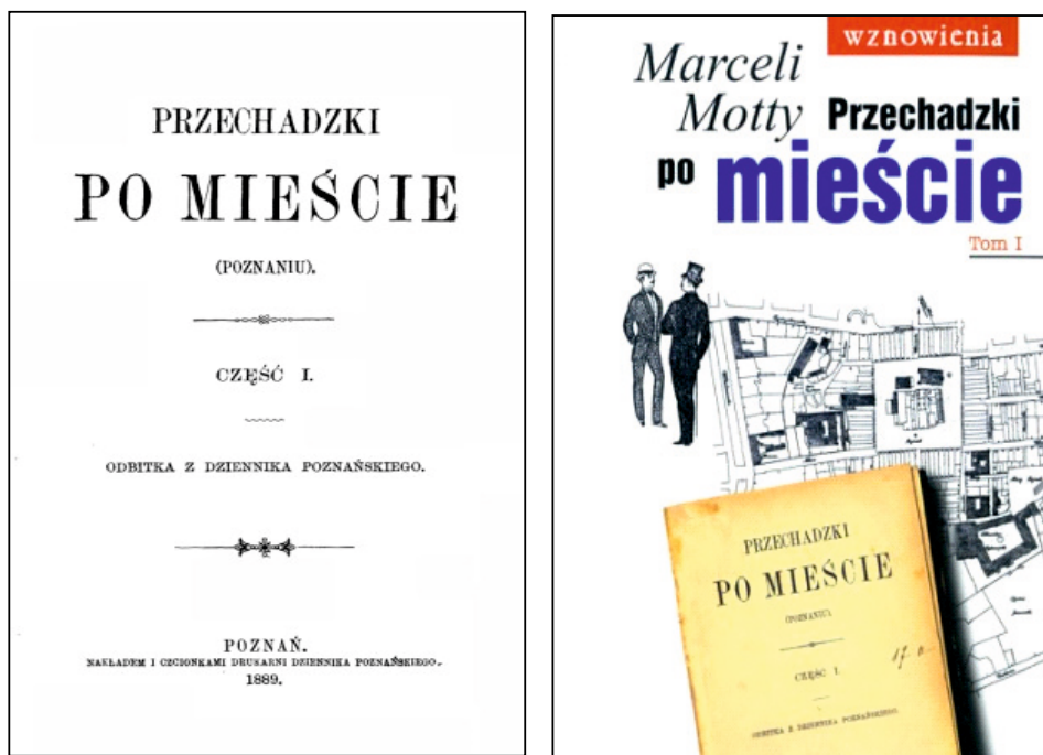
Il. 12. Pierwsze i ostatnie wydanie Przechadzek po mieście – okładki pierwszych tomów