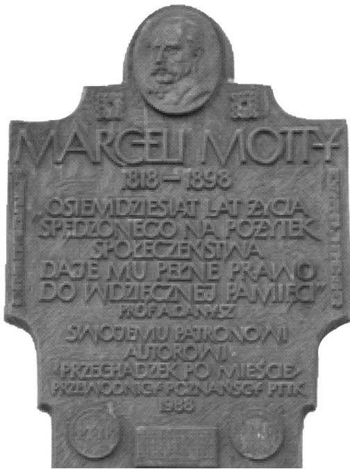
Il. 4. Tablica pamiątkowa fundacji Koła Przewodników PTTK im. M. Mottego w Poznaniu, na ścianie dawnej kamienicy Bergera przy pl. Kolegiackim 5