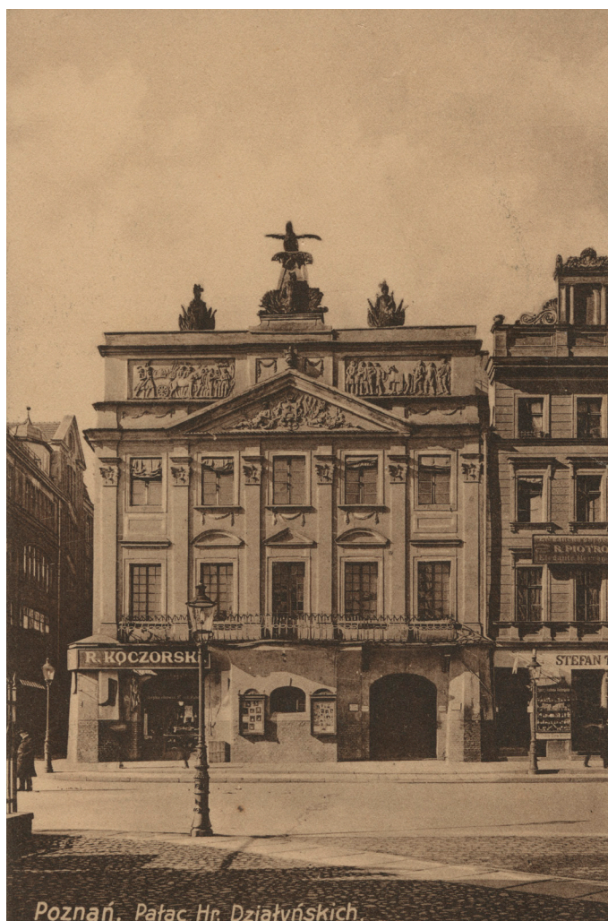
Il. 7. Pałac Działyńskich – pocztówka z około 1910 roku