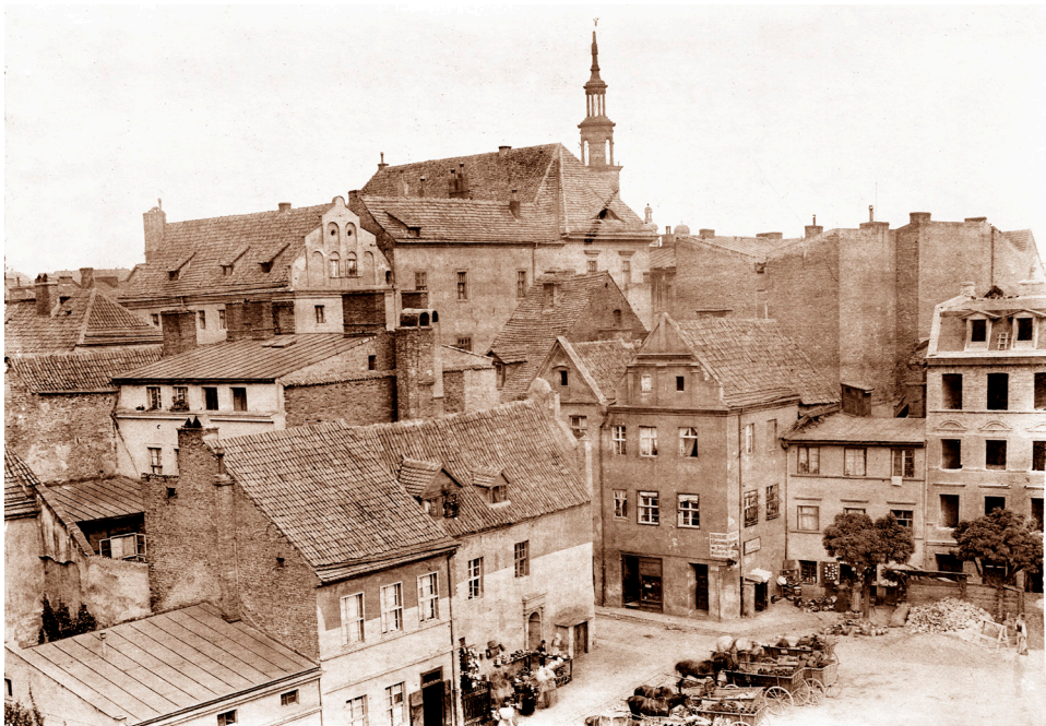
Il. 5. Nowy Rynek – fotografia Friedricha Dahmsa z około 1900 roku