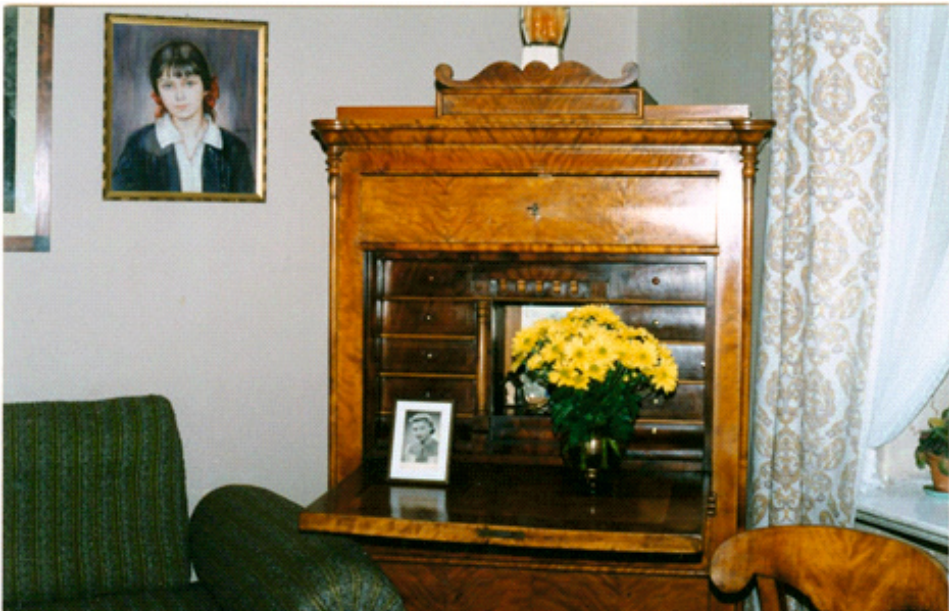
Il. 6. Sekretarzyk, na którym Motty pisał Przechadzki po mieście , obecnie w zbiorach rodziny Mottych

Czytając Przechadzki , należy mieć na uwadze fakt, że to, co autor przekazał, i sposób, w jaki to zrobił, związane są ściśle z jego pozycją społeczną, środowiskiem, w którym się wychował, oraz światopoglądem,