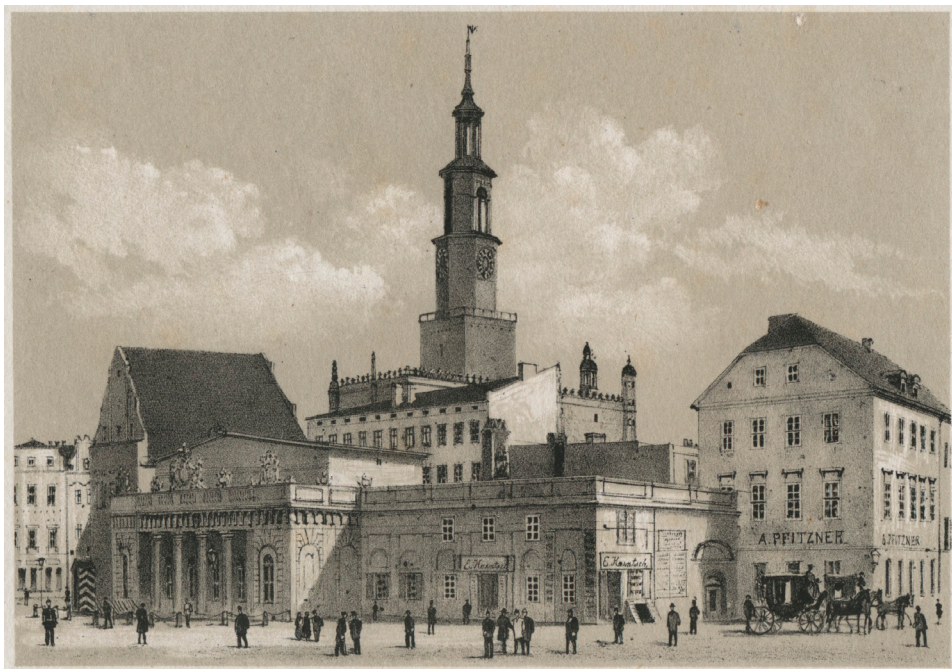
Il. 10. Stary Rynek – litografia R. Geisslera z około 1870 roku z Albumu miasta Poznania. 18 pamiątkowych widoków...

zabudowy, o Rynku pisał: „w kilku miejscach połączono dwa domy w jeden, bo dawniejsza domów struktura nie odpowiednia terażniejszym potrzebom obliczoną była na inne stosunki” 75 . Starał się konfrontować widoki poszczególnych części miasta ze stanem sprzed lat.