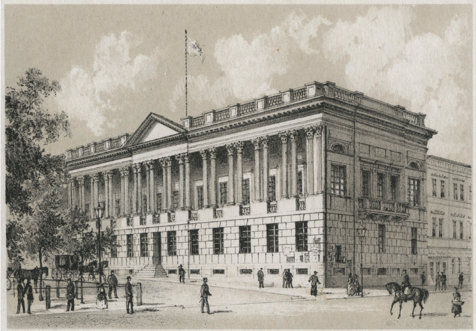
Il. 8. Biblioteka Raczyńskich – litografia R. Geisslera z około 1870 roku z Albumu miasta Poznania. 18 pamiątkowych widoków...