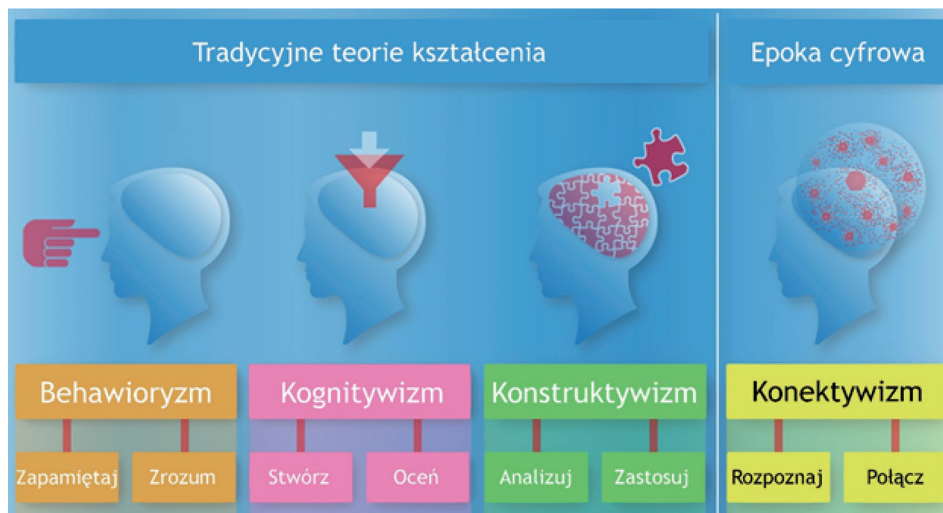
Ryc. 1. Teorie kształcenia

Źródło: < http://www.jankowskit.pl/kognitywistyka/teorie-uczenia.html > [dostęp: 27.03.2018] (tłum. J. Sypniewski)