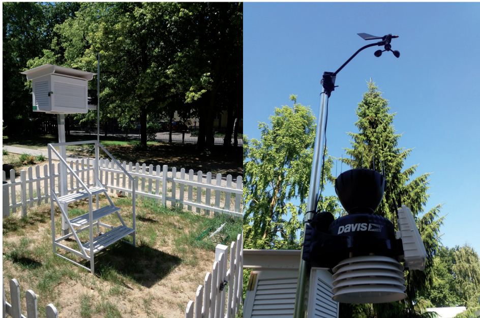
Ryc. 3. Przyszkolny ogródek meteorologiczny przy Szkole Podstawowej nr 83 „Lejery” w Poznaniu

względnej, ciśnienia atmosferycznego, prędkości i kierunku wiatru, opadów atmosferycznych oraz kalkulacji parametrów pochodnych, tj. temperatury punktu rosy, temperatury odczuwalnej i ewapotranspiracji. Na terenie ogródka znajduje się również poletko termometrów gruntowych (ryc. 3).