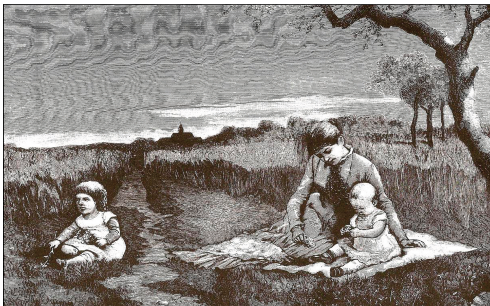
Zabawa kwiatowa , obraz A. Malinge'a, „Biesiada Literacka” 1893, nr 27