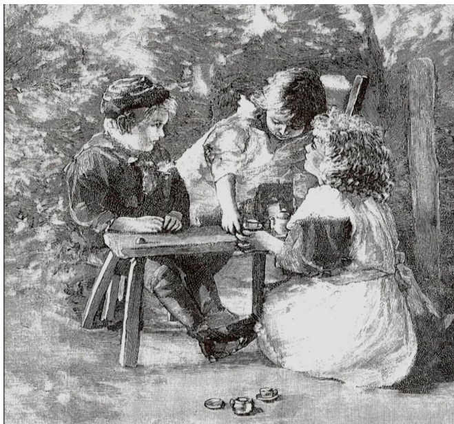
Zabawa po nauce, „Przyjaciół Dzieci” 1893, nr 44