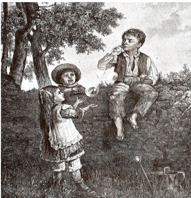
Bański mydlane , rys. E. Perle, ryt. E. Gorazdowski, „Kłosy” 1875, nr 45