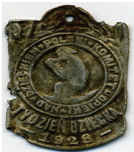
Ryc. 2. Medalik z „Tygodnia Dziecka”, 1928 r.

Święto Dziecka. Drugi dzień poświęcano wychowaniu dziecka w jego początkowych latach życia. Instrukcje zalecały, aby w dniu trzecim zwracać szczególną uwagę na fizyczne wychowanie dziecka, w czwartym na umysłowe, zaś w piątym na moralne. Szósty dzień był dniem, w którym uwaga skupiała się wokół dzieci pracujących oraz kształcących się zawodowo. Zwieńczeniem „Tygodnia Dziecka” był dzień siódmy, który poświęcony był matce jako kobiecie pełniącej rolę wychowawcy oraz pracującej na rzecz dobra ogółu 34 .