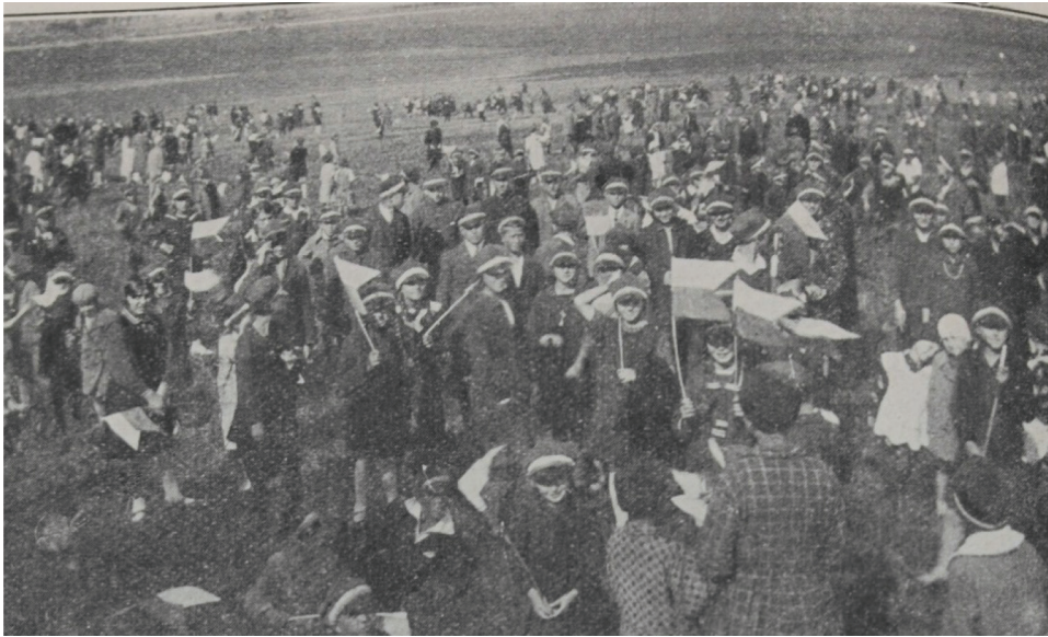
Ryc. 3. Dzieci podczas pochodu w Dniu Dziecka niosące chorągiewki w kolorze biało-zielonym

w jaki sposób należy formować dziecięce pochody. Każdej grupie dzieci przydzielano własny numer, informujący o jej miejscu w pochodzie. Wychowawcy otrzymywali również informację o trasie, którą mają przemaszerować dzieci oraz o miejscu zakończenia pochodu. Przy czym miejsca wybierano celowo i musiały one posiadać wartość historyczną 37 . W Warszawie w 1930 r. uczniowie uczestniczący w pochodzie złożyli przy dźwiękach hymnu narodowego kwiaty u stóp pomnika Adama Mickiewicza. Następnie pochód udał się w kierunku Zamku Królewskiego, gdzie uczniowie złożyli hołd honorowej przewodniczącej Polskiego Komitetu Opieki nad Dzieckiem, Michalinie Mościckiej, żonie prezydenta Ignacego Mościckiego. Po wizycie u Pani Prezydentowej dzieci udały się do Grobu Nieznanego Żołnierza i złożyły kwiaty, po czym pochód został rozwiązany, a poszczególne szkoły rozeszły się do parków i ogrodów miejskich, aby tam spędzić czas na wesołej zabawie 38 . Po zakończeniu pochodu w miejscu wcześniej ustalonym, miał miejsce krótki odpoczynek. Dzieci otrzymywały wówczas posiłek, na który składało się słodkie pieczywo, lemoniada, mleko oraz słodczyce i inne przysmaki 39 . Kiedy odpoczynek dobiegł końca, a posiłek został zjedzony dzieci udawały się do teatrów oraz kin, gdzie czekały na nie kolejne atrakcje w formie różnych przedstawień. Nie były to jednak sztuki przypadkowe. Przedstawiane dzieciom sztuki były wesołe i pogodne z uwagi na cha-