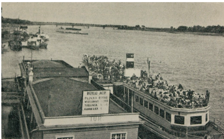
Ryc. 6. Rejs statkiem po Wiśle zorganizowany w ramach Tygodnia Dziecka, Warszawa 1930 r. Źródło: „Opieka nad Dzieckiem” 1930, nr 6, s. 315