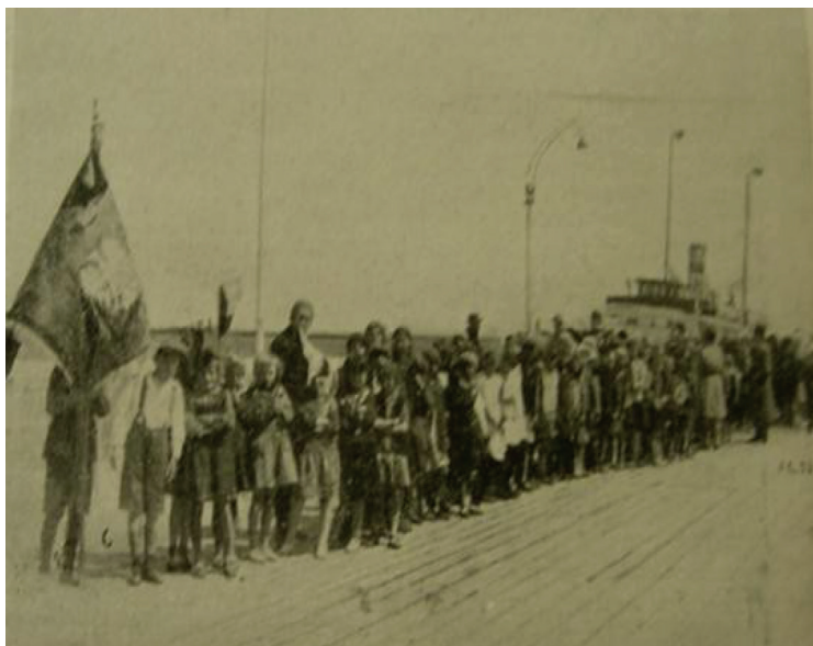
Ryc. 7. Dzieci na sopockim molo

W związku z czwartym dniem Tygodnia Dziecka otwierano drzwi przedszkoli oraz szkół. Zapraszano prominentów z miasta do placówek szkolnych, gdzie uczniowie przygotowywali wystawy swoich prac. Organizowano również różnego rodzaju odczyty, których celem było wyjaśnienie sensu funkcjonowania poszczególnych placówek i instytucji wychowawczych. Miało to przyczynić się do wzrostu zainteresowania tymi placówkami wśród społeczeństwa oraz pozytywnie wpłynąć na współpracę wychowawców i rodziców. Polski Komitet Opieki nad Dzieckiem zalecał również odwiedzanie placówek dla dzieci niepełnosprawnych intelektualnie, a w przypadku gdy takiej placówki nie było w danej miejscowości, wówczas komitety wojewódzkie zlecały ekspertom z pedagogiki specjalnej wygłoszenie odczytu z zakresu podmiotowego traktowania dzieci niepełnosprawnych 46 .