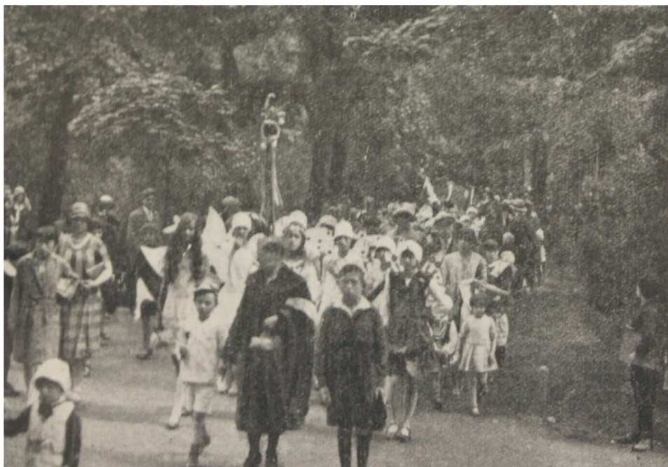
Ryc. 4. Pochód dzieci w Ogrodzie Saskim w Warszawie, 1930 r.