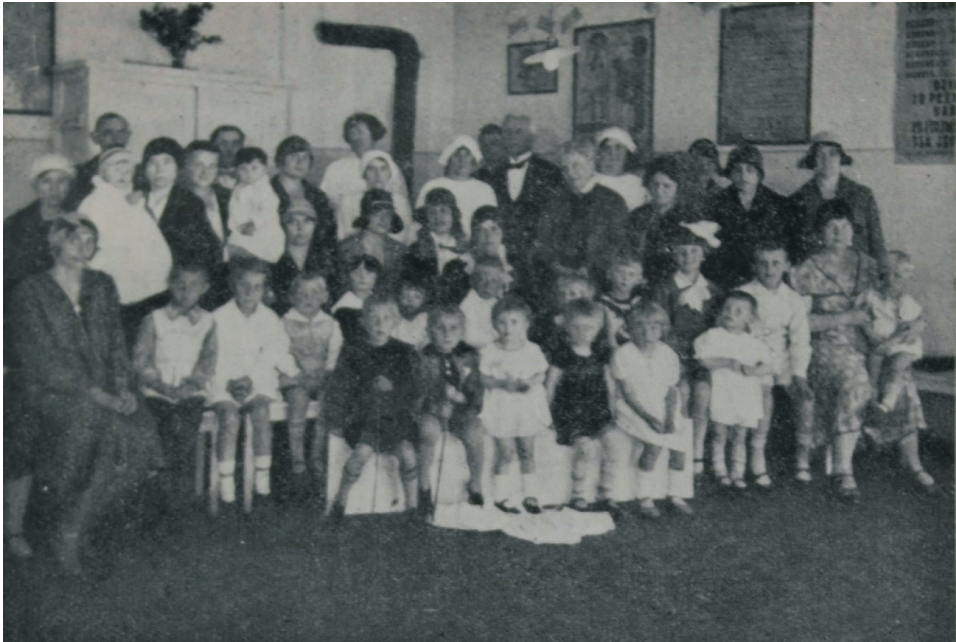
Ryc. 8. Matki odznaczone w 1929 r. z okazji „Tygodnia Dziecka” w Stacji Opieki nad Dzieckiem PKOD, Warszawa ul. Podwale 50

Źródło: „Opieka nad Dzieckiem” 1930, nr 6, s. 315