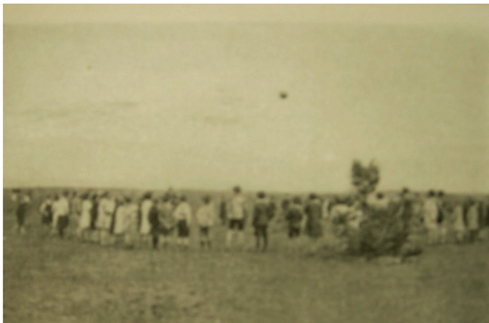
Ryc. 5. Dzieci z warszawskiej szkoły nr 197 podczas gry w piłkę w Dniu Dziecka

atrakcji był m.in.: rejs statkiem po Wiśle, przedstawienia w kinach, pokazy gimnastyczne w Agrykoli 40 .