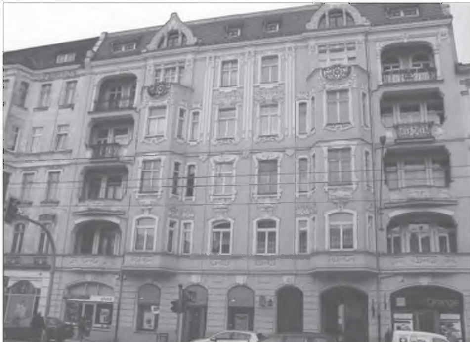
Il. 9. Kamienica przy ul. Głogowskiej w Poznaniu.