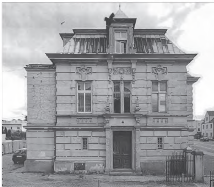
Il. 5. Willa Wilczewskich, stan obecny.