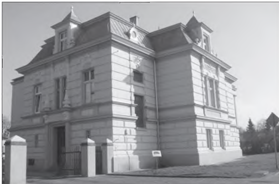
Il. 4. Willa Wilczewskiego we Wronekach. Pocztówka ze zbioru Muzeum w Szamotułach