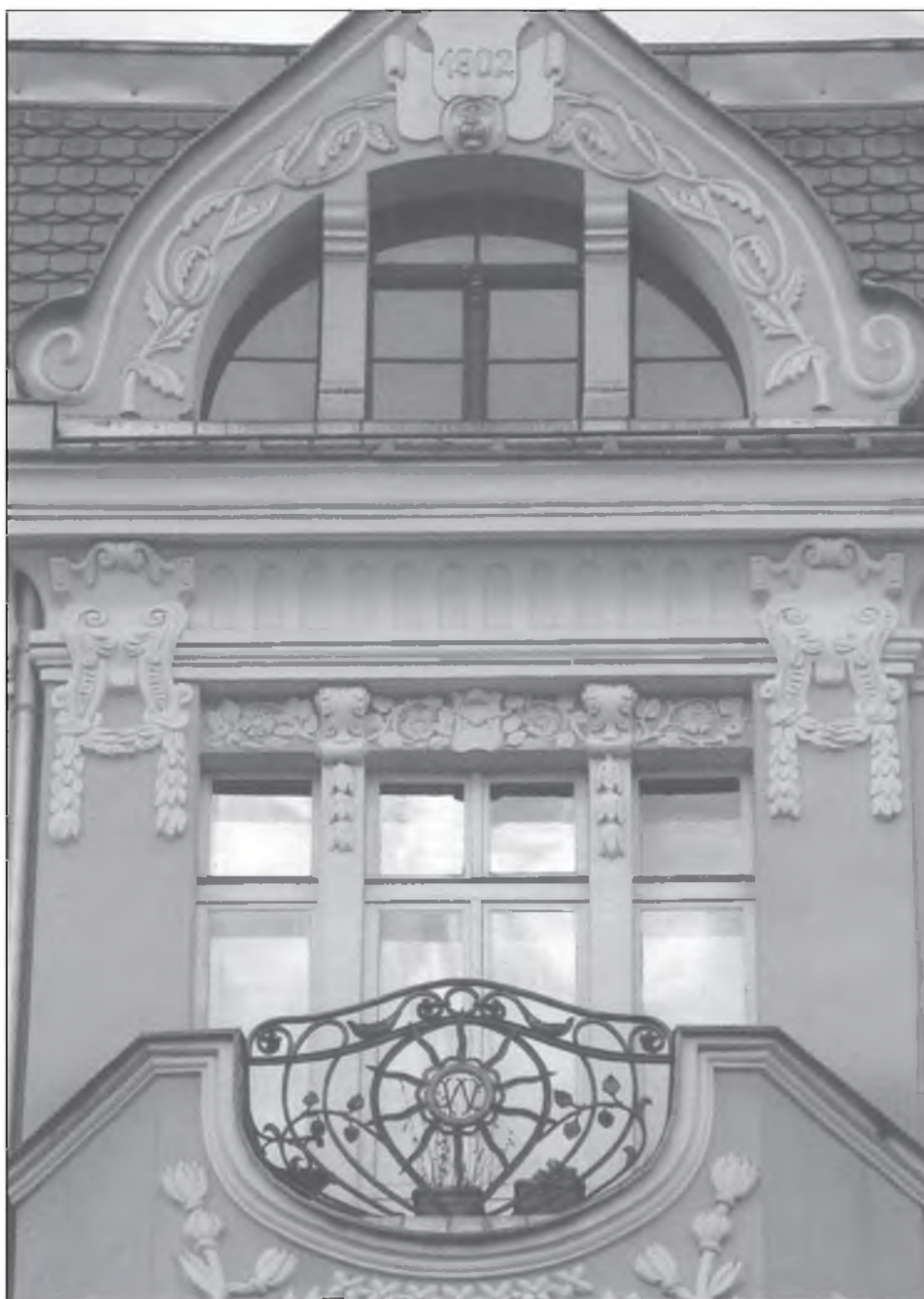
Il. 10. Krata z inicjałami M. Wilczewskiego na balkonie kamienicy.