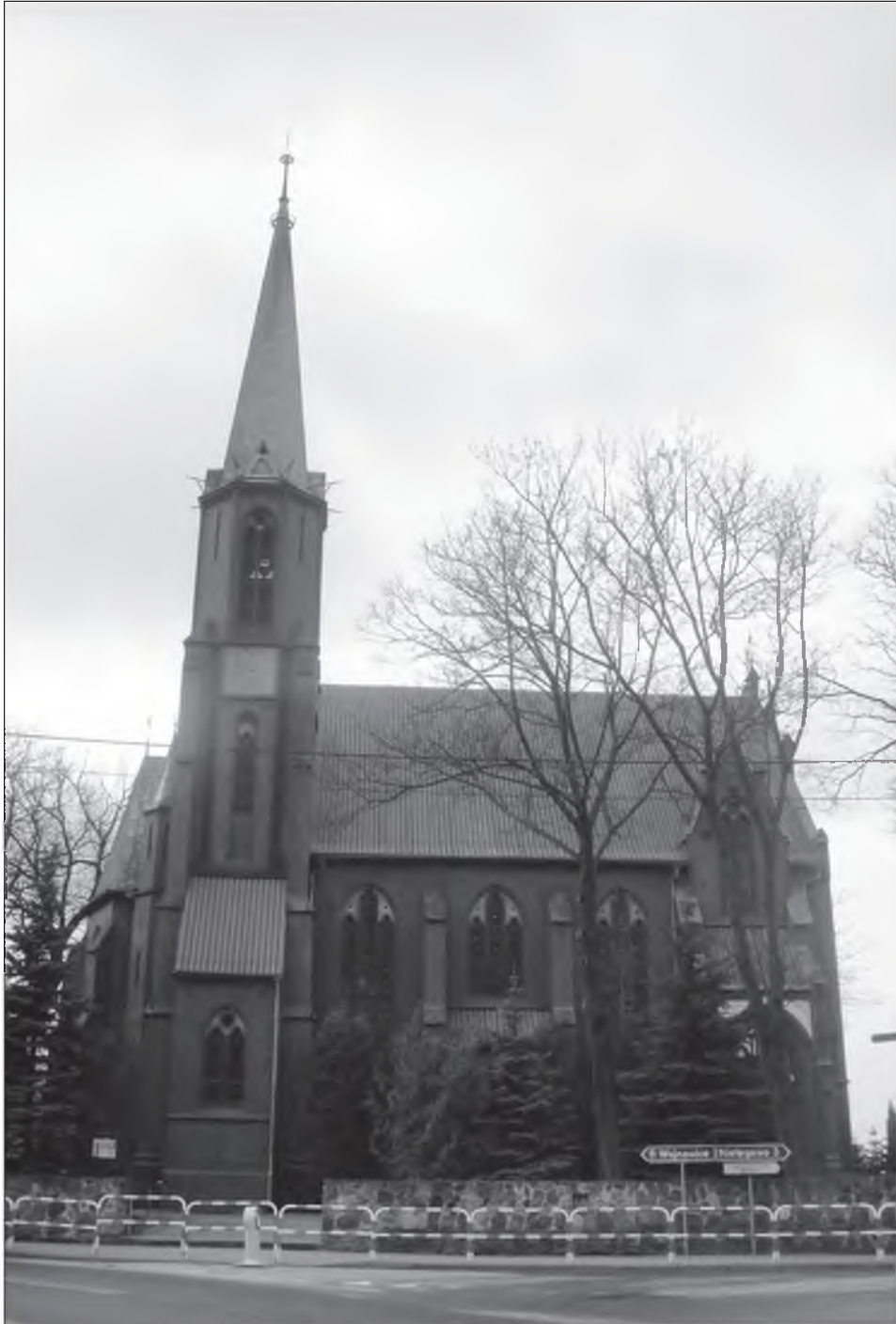
Il. 8. Kościół w Gryżynie.