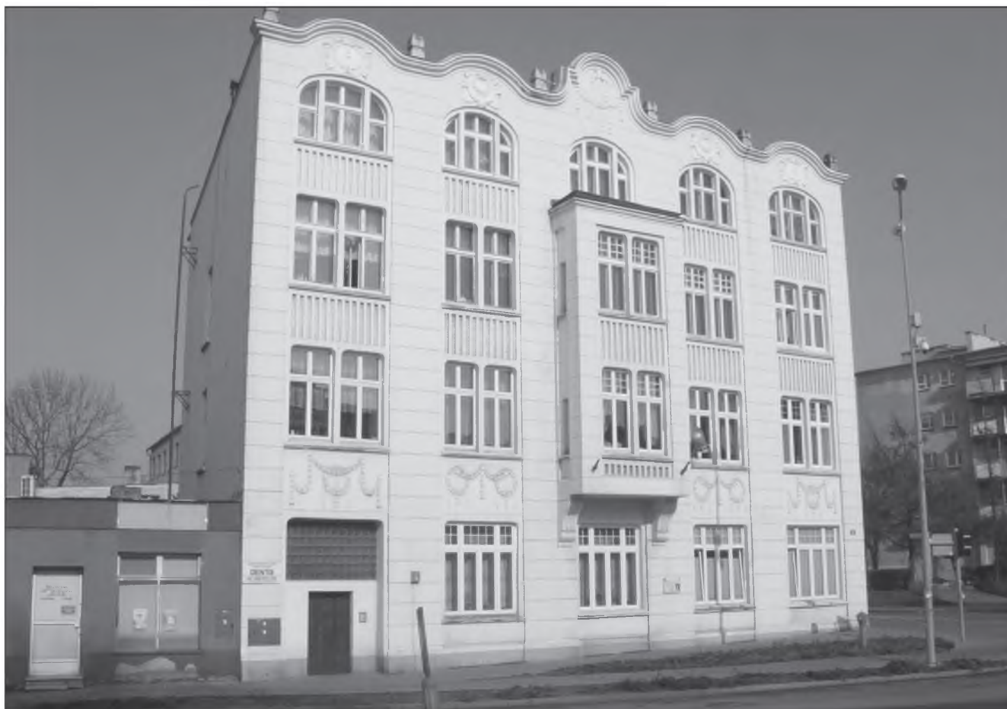
Il. 6. Hotel Kammlera we Wronkach.