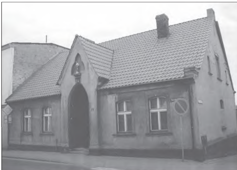
Il. 7. Organistówka we Wronkach.

W latach osiemdziesiątych Maksymilian wznosił we Wronkach dwa hotele: Kammlera w 1886 r. przy ul. Poznańskiej (il. 6) wyróżniający się secesyjną dekoracją elewacji, a niedługo potem również hotel dla Józefa Krzyżankiewicza przy ul. Sierakowskiej. Kolejne budynki użyteczności publicznej to okazały neogotycki budynek poczty czy Szkoła Męska przy ul. Obrzyckiej. W 1898 r. zbudował skromny parterowy szpital parafialny z organistówką (il. 7). W 1901 r. wspomniany dom matki ks. Grabowskiego przebudował na Dom Jadwigi z sierocińcem i ochronką przy ul. Kościuszki. W tym samym roku powstała piętrowa