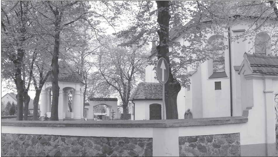
Fot. 7. Obecny wygląd kościoła w Sobocie