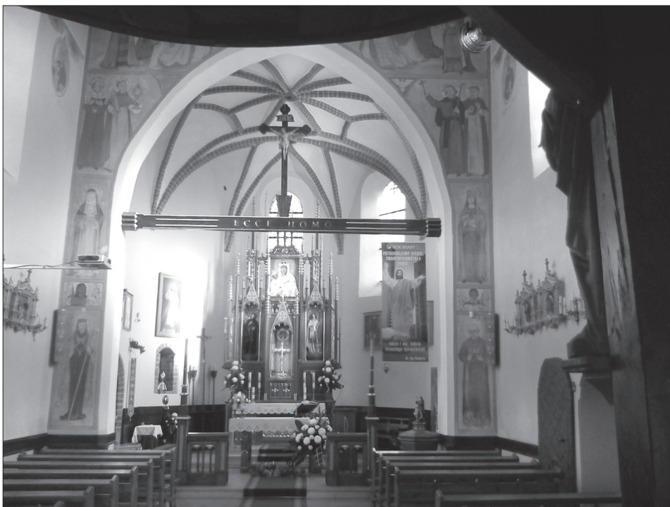
Fot. 8. Wnętrze kościoła i ołtarz