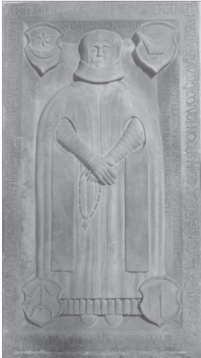
Fot. 3. Płyta nagrobna Katarzyny ze Splawskich, zm. w 1564 r., żony Mikołaja