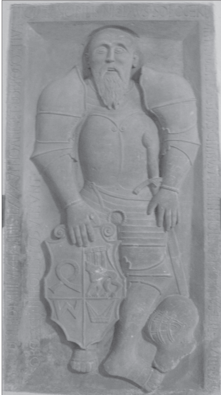
Fot. 2. Płyta nagrobna Mikołaja Sobckiego, zm. w 1564 r.