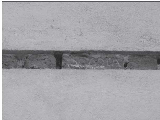
Fot. 4-6. Napis wryty w cegle na szczycie ściany zakrystii kościoła – zob. przypis 45