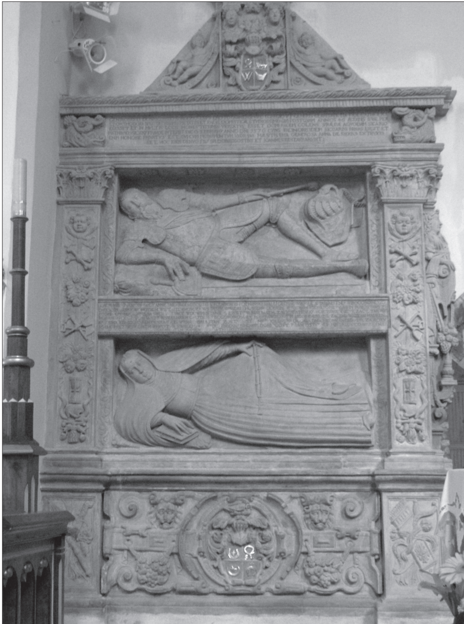
Fot. 1. Nagrobek Dobrogosta Sobockiego stolnika poznańskiego, zm. w 1576 r., i jego żony Anny z Kierskich, zm. w 1601 r.