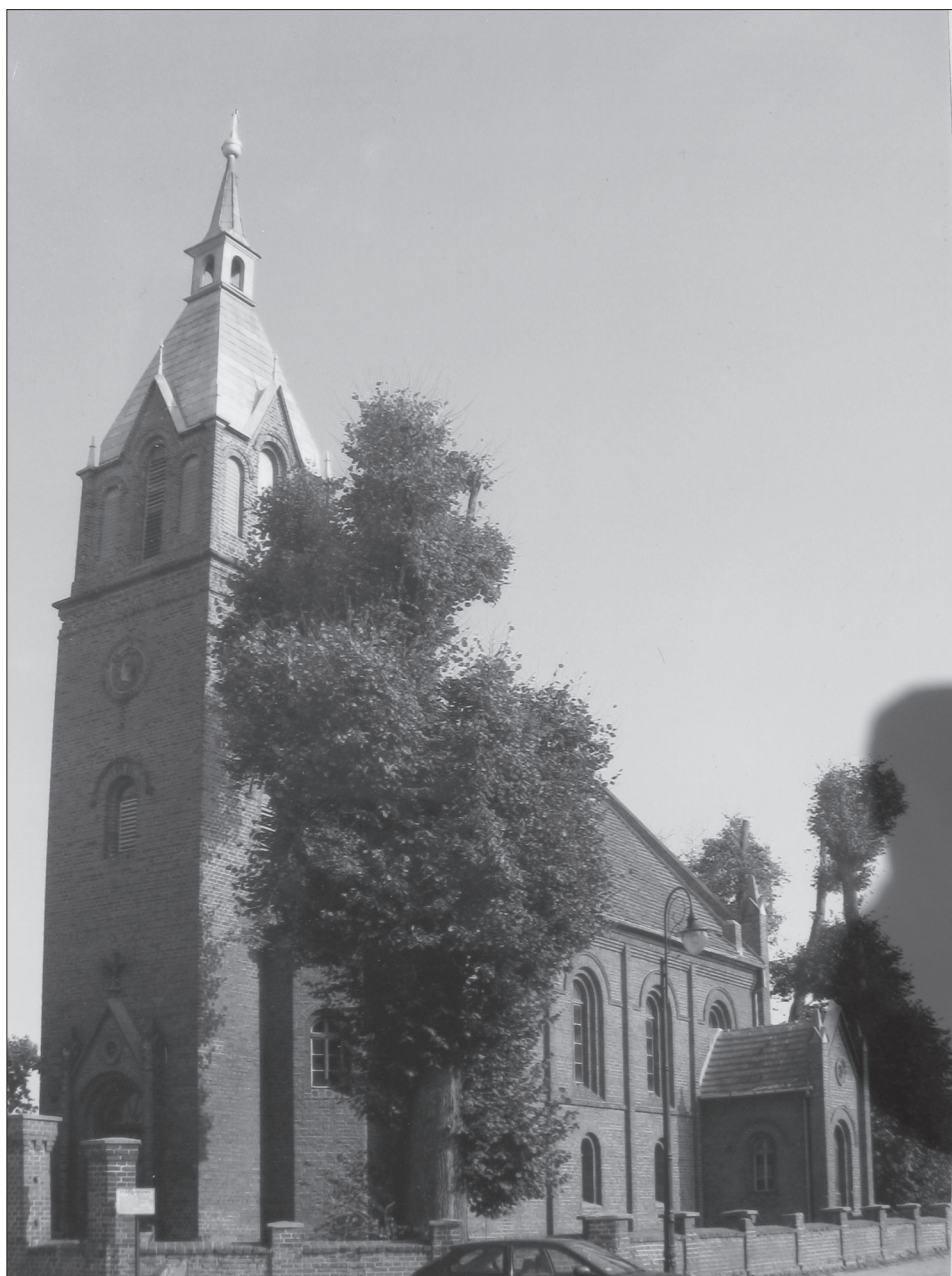
Widok ogólny kościoła.