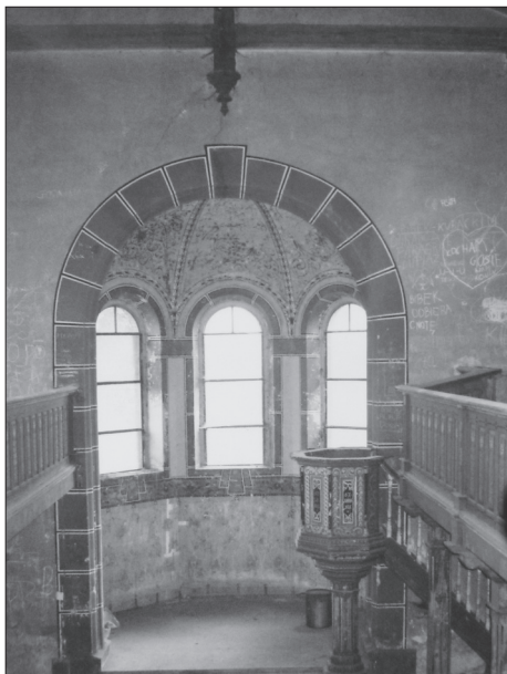
Wnętrze – widok na apsydę.