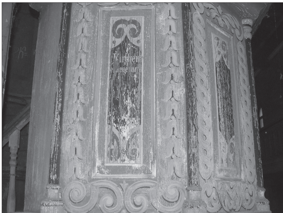
Fragment polichromii ambony.