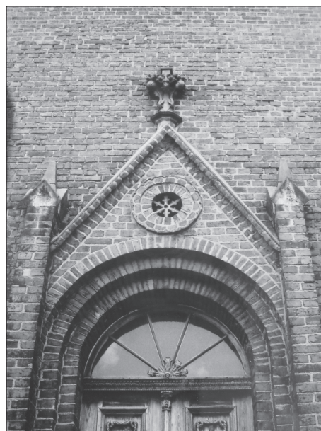
Górna część głównego portalu.