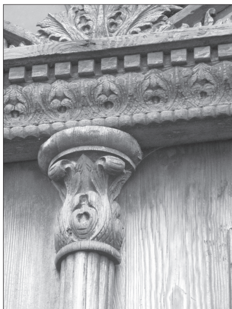
Fragment snycerki drzwiowej.