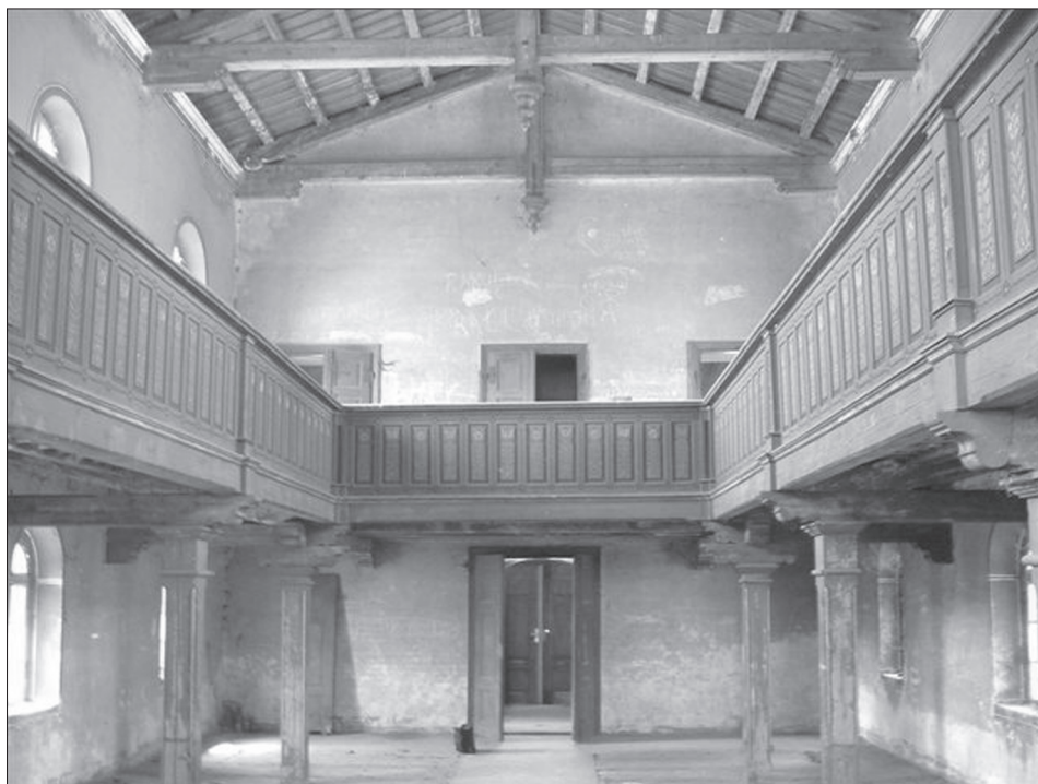
Wnętrze – widok na emporę.

Wizytacje za czasów pastora Paula Rückera 20 (1894-1908) także potwierdzały to, że nadal oddzielnie modlili się ludzie w języku polskim i niemieckim. Wśród zacytowanych pieśni śpiewanych po polsku były: Boże racz się zmiłować czy Przybliża się dzień sądowy . Według H. Rybarka nabożeństwa w języku polskim odprawiano do roku 1900, natomiast wizytator w roku 1905 potwierdził jeszcze prowadzenie polskich niedzielnych nabożeństw o godz. 8 rano.