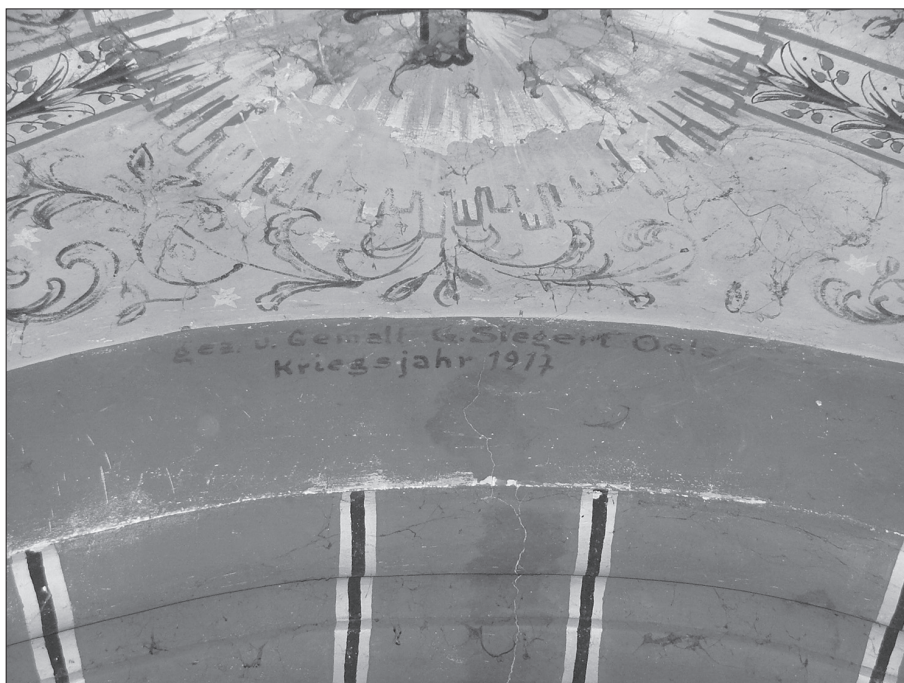
Inskrypcja na polichromii. Fot. B. Krzyślak