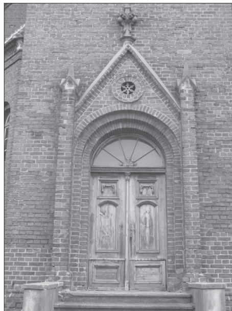
Główne wejście do wnętrza.