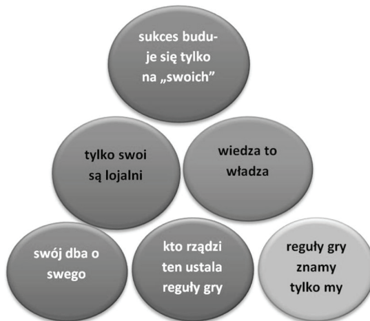
Rys. 2. Piramida wiedzy syndromu plemienności

Jeśli przekształcić naszą piramidę wartości w piramidę wiedzy, to mogłaby ona prezentować się jak na Rys. 2. Zabieg