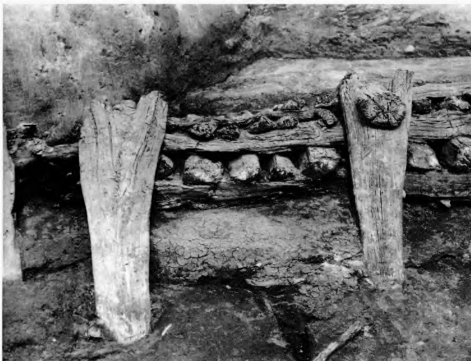
Ryc. 2. Białogard, stanowisko 1. Fragment lica wału 6 fazy osadniczej. Widok od strony wnętrza grodu Abb. 2. Białogard, Fst. 1. Fragment der Wallfront der sechsten Phase. Ansicht von der Innenseite des Burgwalles

W podsumowaniu swej szczegółowej analizy T. Ważny stwierdził, że drewno próbek nr 5 (z dolnej części rusztu) oraz 9 i 10 (luźne pale) pochodzi ze ścinki przeprowadzonej jesienią 902 r. lub zimą 902/903 r. Natomiast drewno próbek nr 2 i 4 (pionowe słupy oblicowania) oraz 3, 6 i 7 (z rusztu) zostało ścięte w latach 878–892. Nie udało się określić wieku próbek nr 1, 8, 11 i 12. Ponadto T. Ważny, powołując się na bardzo duże podobieństwo krzywej przyrostowej drewna próbek nr 4 (rozpołowiony pień – pal pionowy oblicowania) i nr 6 (ruszt), był skłonny uznać je za pochodzące z tego samego drzewa 14 . Obydwa te elementy wiążą się ściśle z tym samym odcinkiem konstrukcji wału, co czyni powyższe przypuszczenie bardzo prawdopodobne.