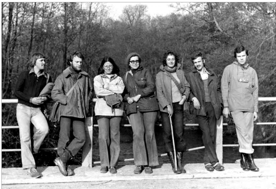
Ryc. 4. Październik 1977 r. – Ekspedycja Łupawska w odnowionym składzie czeka na wymarsz na badania powierzchniowe w Łupawie, na moście nad rzeką o tej samej nazwie