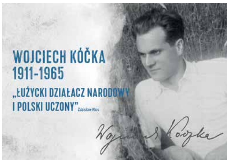
Ryc. 1. Plansza tytułowa wystawy Wojciech Kóčka (1911–1965) – „Łużycki patriota, polski uczoney” otwartej 13 października 2021 roku w Bibliotece Collegium Historicum UAM (oprac. Liliana Bether)