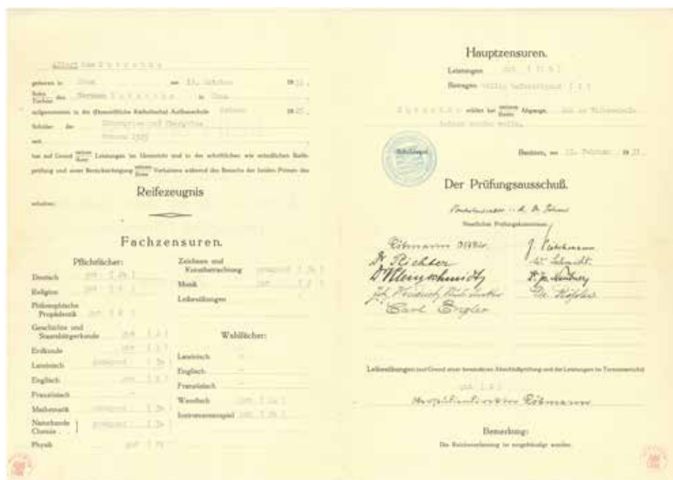
Ryc. 2. Świadectwo maturalne Wojciecha Kóčki (Alberta Kutschke) wystawione w Budziszynie (Bautzen) z datą 23 lutego 1931 roku (Archiwum UAM, sygn. 103b/1233)