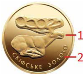
Ryc. 10. Rewers 2 hrywien z 2011 roku

W odniesieniu do ostatniej monety, na podstawie strony internetowej NBU, w kontekście 2 hrywien z 2011 roku zamieszczono informację, że upamiętniono scytyjski artefakt jubilerski, jakim jest złota plakietka jelenia z kurhanu w Siniawkach w obwodzie czerkaskim.