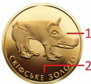
Ryc. 9. Rewers 2 hrywien z 2009 roku

Następny numizmatyczny przykład upamiętnienia zabytków scytyjskich stanowią 2 hrywny z 2009 roku. Na stronie internetowej NBU można znaleźć informację, że moneta również poświęcona jest scytyjskiemu artefaktowi jubilerskiemu. Zawarto na niej motyw figurki dzika z kurhanu Chomina Mohyła w pobliżu wsi Nahirne w obwodzie dniepropietrowskim.