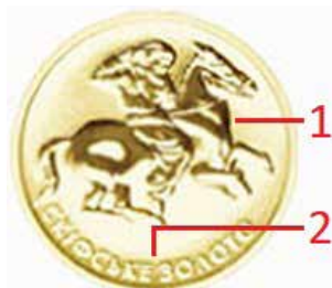
Ryc. 2. Rewers 2 hrywien z 2005 roku

Kolejnym artefaktem pochodzącym ze wspomnianego kurhanu była złota blaszka w kształcie konnego Scyty uwieczniona na 2 hrywnach z 2005 roku. Na stronie internetowej NBU zawarto informację, że moneta upamiętnia okres scytyjski oraz wybitne dokonania sztuki jubilerskiej tamtego czasu.