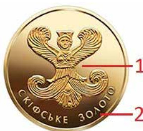
Ryc. 8. Rewers 2 hrywien z 2008 roku

W kontekście następnej monety, tj. 2 hrywien z 2008 roku, na stronie internetowej NBU zawarto informacje, że moneta jest poświęcona artefaktowi kultury scytyjskiej – złotej aplikacji z przedstawieniem bogini Apii.