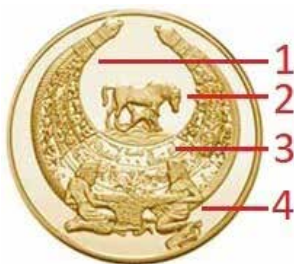
Ryc. 3. Rewers 100 hrywien z 2003 roku

Kolejna moneta z motywem scytyjskim to 100 hrywien z 2003 roku. Na stronie internetowej NBU zawarto informację, że monetę poświęcono złotemu pektorałowi z Towstoj Mohyły stanowiącemu arcydzieło sztuki helleńskiej i scytyjskiej oraz dokonaniom archeologa Borysa Mozełewskiego, odkrywcy pektorału.