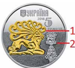
Ryc. 5. Awers 5 hrywien z 2016 roku

Kolejne nawiązania do Towstoj Mohyły zostały zawarte na dwóch monetach o wartości 5 hrywien z 2016 i 2018 roku. Na stronie internetowej NBU w kontekście monety z 2016 roku zamieszczono informację, że tematyka dedykowana jest wyobrażeniom jelenia występujących na różnych zabytkach. Na awersie monety odwzorowano motyw „głowicy” ze stylizowanym jeleniem pochodzący ze wspomnianego kurhanu. Na rewersie zamieszczono wyobrażenie jelenia pochodzące z kurhanu we wsi Busha w rejonie jampolskim, w obwodzie winnickim.