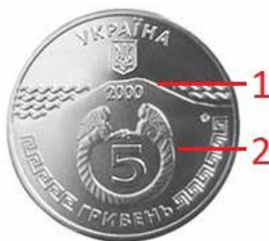
Ryc. 1. Awers 5 hrywien z 2000 roku

Pierwszym artefaktem przedstawionym na 5 hrywnach z 2000 roku była bransoleta znaleziona w kurhanie Kul-Oba. Na stronie internetowej NBU przy opisie monety zamieszczono informację, że moneta upamiętnia 2600-lecie miasta Kercz oraz kolonizatorską działalność starożytnych Greków.