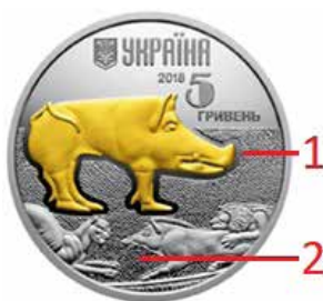
Ryc. 6. Awers 5 hrywien z 2018 roku