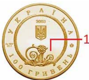
Ryc. 4. Awers 100 hrywien z 2003 roku (źródło: strona internetowa NBU)

Fig. 4. Obverse of 100 hryvnia coin from 2003 (source: NBU website)