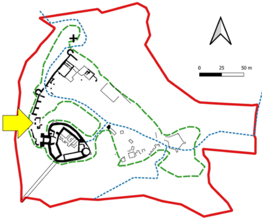
Ryc. 6. Zarys murów zamkowych z uczynionymi elementami, odsłoniętymi podczas badań archeologicznych (czarna linia ciągła – strzałką wskazano relikty nadbudowane w formie murków) oraz reliktyami rozpoznanyymi podczas badań archeologicznych – bez uczynienia in situ (czarna linia przerywana). Linia niebieska – przybliżony ciąg turystyczny, linia zielona – granica krawędzi wzgórza zamkowego (zamek dolny i górny). Oprac. R. Zapłata

Fig. 6. An outline of the castle walls with maked accessible elements, uncovered during archaeological research (black solid line – the arrow indicates relics built on in the form of walls) and relics identified during archaeological research – without maked accessible in situ (black dashed line). Blue line – approximate tourist route, green line – border of the edge of the castle hill (lower and upper castle). Prepared by R. Zapłata