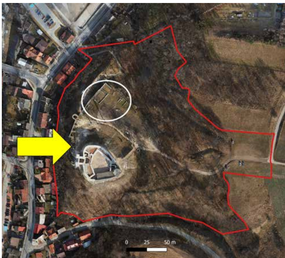
Ryc. 5. Fragment ortofoto – widok z góry wzgórza zamkowego z zaznaczeniem uczytelnionych reliktyw (białe koło) oraz niedostępnych dla turystów reliktyw (żółta strzałka) – odsłoniętych podczas badań archeologicznych, z przybliżoną granicą zabytku (linia czerwona).

Kolejną niejako częścią dawnego założenia jest samo wzgórze zamkowe, którego czytelność w pewnym sensie stopniowo zanika. Wzgórze niszczą różnorodne pro-