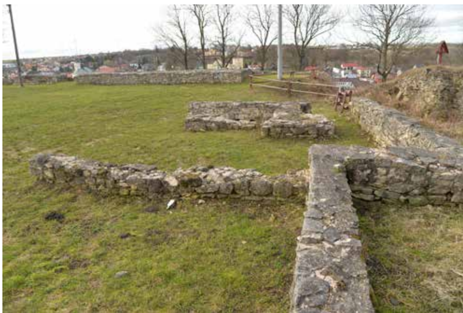
Ryc. 9. Uczytelnienie wybranych, podpowierzchniowych reliktyw zabudowy zamku dolnego w postaci nadbudowanych murków in situ .