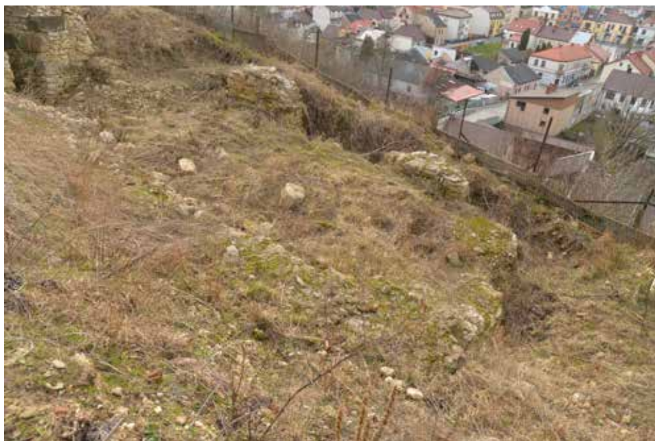
Ryc. 8. Odślonięte relikty wieży przedbramnej – badania archeologiczno-architektoniczne z 2019 r. (Lechowicz, 2019). Relikty poza udostępnianiem turystom.

Zasłanianie zamiast uczynienia – tak można by określić inne zjawisko, jakie również charakteryzuje ruinę zamku w Iłży. Otóż wzgórze zamkowe w czasach jego świetności, przynajmniej z czasów najstarszych przekazów ikonograficznych (XVII wieku), było niemalże całkowicie pozbawione roślinności, zwłaszcza wysokiej, czyli drzew, jak i średniej – krzewów. Obecnie obserwujemy efekt wieloletniego i niekontrolowanego w większości rozrostu samosiewnej roślinności, przy częściowych zabiegach podcinania odrostów, tudzież usuwania obiektów zagrażających zwiedzającym. Roślinność, zwłaszcza drzewa, stopniowo przysłaniają zarówno rzeźbę wzgórza zamkowego, a zarazem fragmenty ruiny. Pomijając kwestie związane z negatywnym wpływem roślinności na niektóre fragmenty wzgórza i zamku, mając zarazem na uwadze ich – miejscami – pozytywny wpływ na zbcza zamkowe, warto zwrócić uwagę, że poza malejącą stopniowo czytelnością dawnego założenia, wzrasta nie-