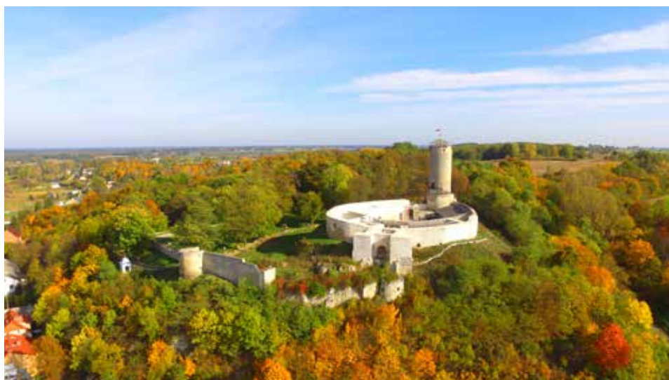
Ryc. 2. Współczesne zdjęcie części wzgórza – widok od strony południowo-zachodniej. Znaczną część wzgórza zamkowego pokrywa (dominująca na zboczach) roślinność średnia i wysoka. Fot. P. Cheda (2024). Zbiory: Urząd Miasta w Iłży