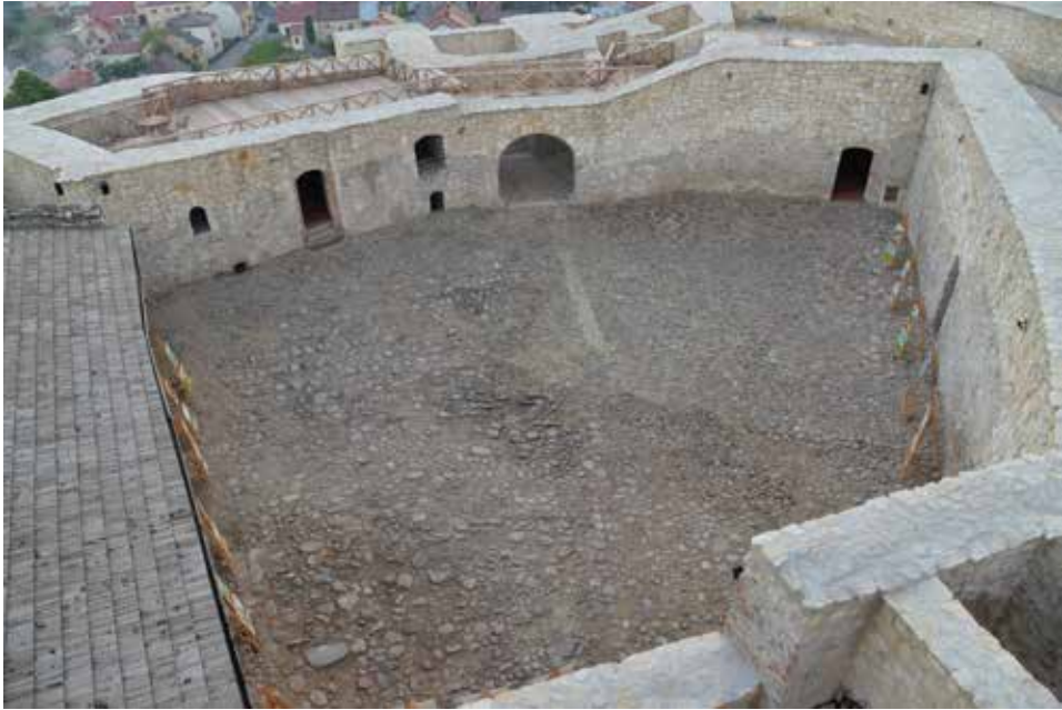
Ryc. 4. Widok dziedzińca zamku górnego w Iłży po pracach odtworzeniowo-konserwatorskich w 2021 r. – bez uczynienia relikwów / bez zarysu tzw. Domu Wielkiego. Fot. R. Zapłata (2022)