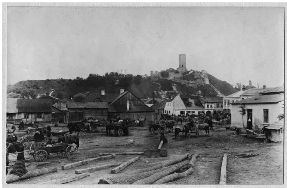
Ryc. 1. Zdjęcie archiwalne – widok na wzgórze zamkowe od strony zachodniej – większość terenu pozabawiona średniej i wysokiej roślinności. Fot. H. Podębski (1914). Zbiory Fotografii i Rysunków Pomiarowych Instytutu Sztuki PAN

Na potrzeby poniższego tekstu uczytelnianie 1 rozumiane jest dwojako: (1) jako formalny proces, w ramach działań muzealnych – wystawienniczych, a także jako (2) proces w pewnym sensie niejednoznaczny z formalną (i pełną) prezentacją, gdzie