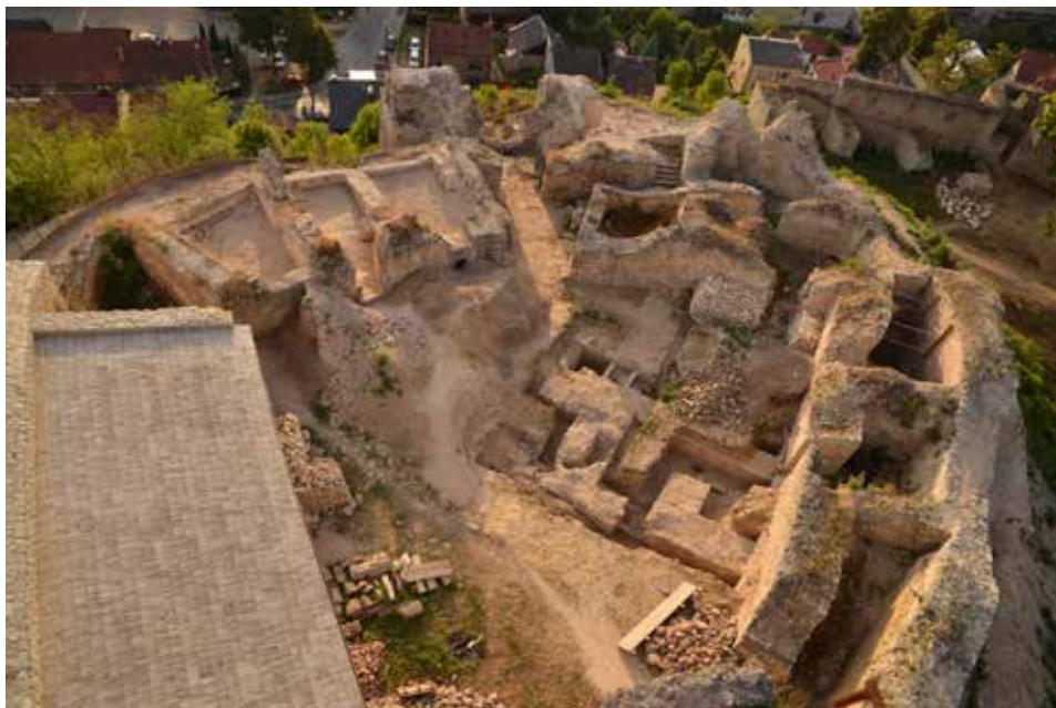
Ryc. 3. Widok dziedzińca zamku górnego w Iłży podczas badań archeologiczno-architektonicznych (Lechowicz i in., 2015). Zaznaczono relikty fundamentów tzw. Domu Wielkiego.

Choć poniższy tekst (z uwagi na objętość i charakter) nie zgłębia (jakże istotnych) zagadnień związanych z ideami ekspozycji, interpretacji i odbioru przekazu muzealnego, warto w tym miejscu omówić kilka kwestii. Ideą muzealizacji, w tym uczytelniania elementów dawnych założeń, jest m.in. edukacja, popularyzacja wiedzy o dziedzictwie kulturowym itd. Tak też należy widzieć różnorodne działania i reali-