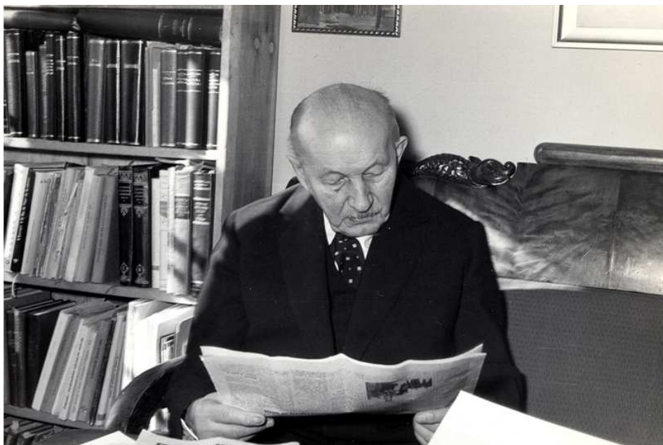
Ryc. 1. Józef Kostrzewski, współzałożyciel Uniwersytetu Poznańskiego oraz Instytutu Prehistorycznego. Był dyrektorem Instytutu w latach 1919–1950, z wyłączeniem okresu II wojny światowej; kierownikiem Katedry w latach 1956–1960