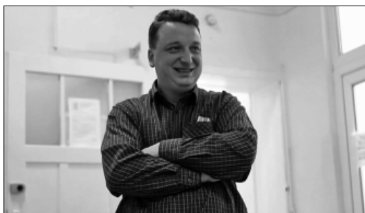
Birth , dir. Karol Starnowski (Łódź from Dawn till Dusk), prod. Polish National Film School in Lodz, 2011