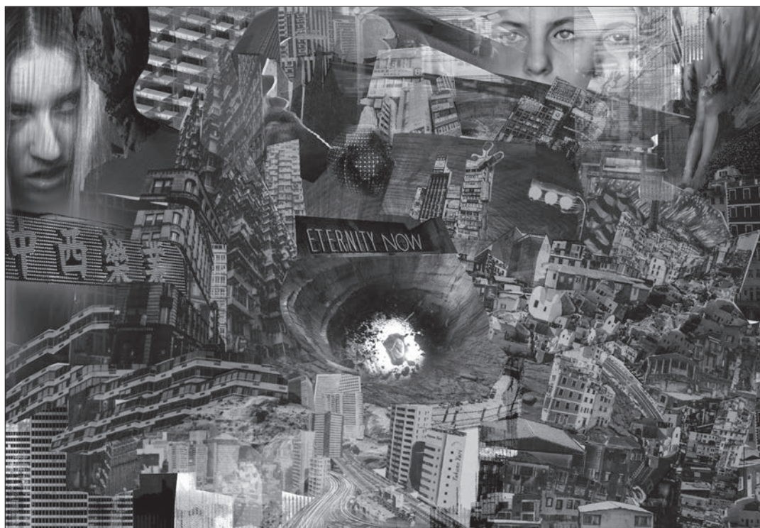
Eternity, Made in abyss