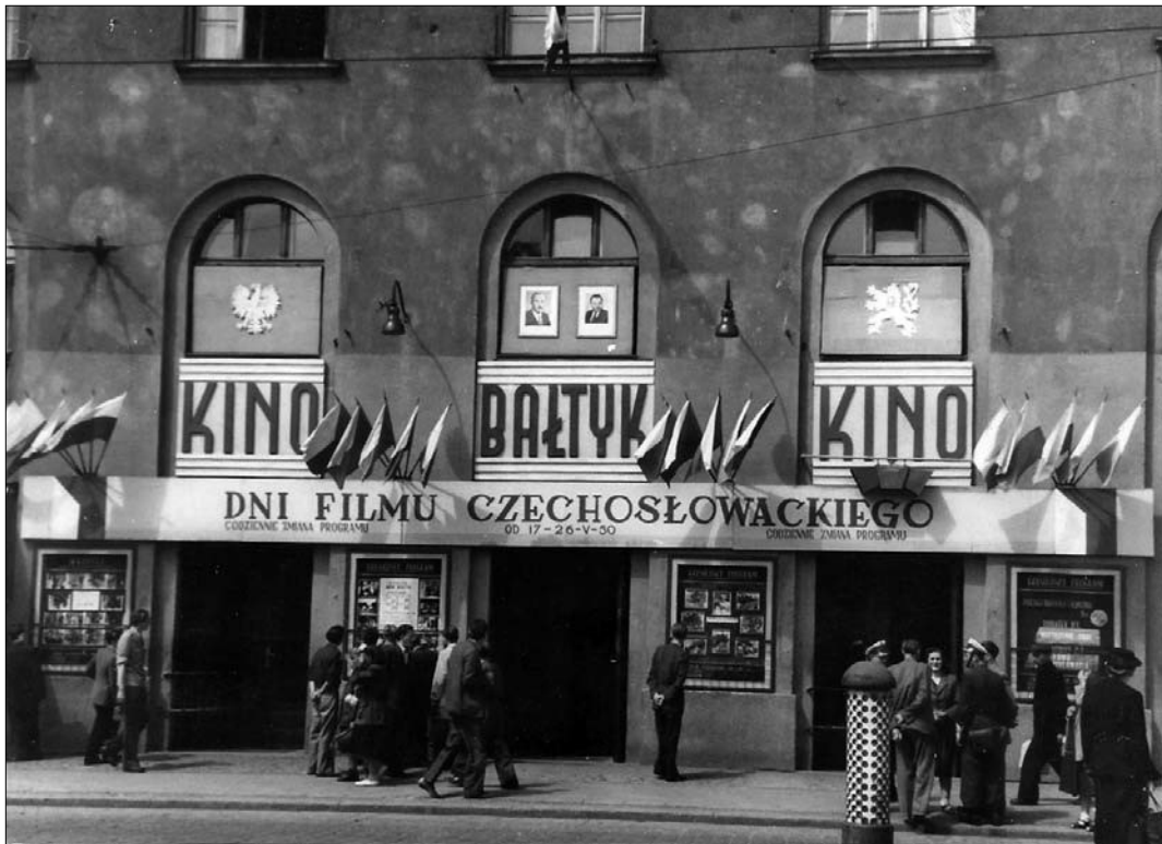
Kino Bałtyk w Poznaniu (1950)