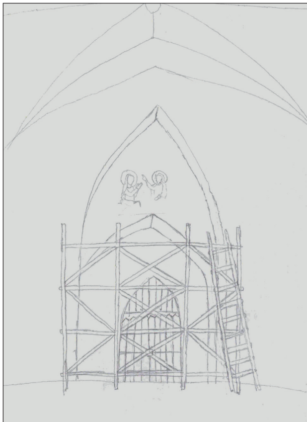
Ryc. 1. Rysunek Studenta 1

dyktyнки, kolejno kler diecezjalny, a później, do XIX wieku, znów benedyktyńki. W XIX stuleciu kościół zmienił swój status i stał się świątynią parafialną. Wobec tego szkic przedstawia dzień utworzenia parafii oraz wejście „szczęśliwych parafian, idących do swojej parafii” 12 .