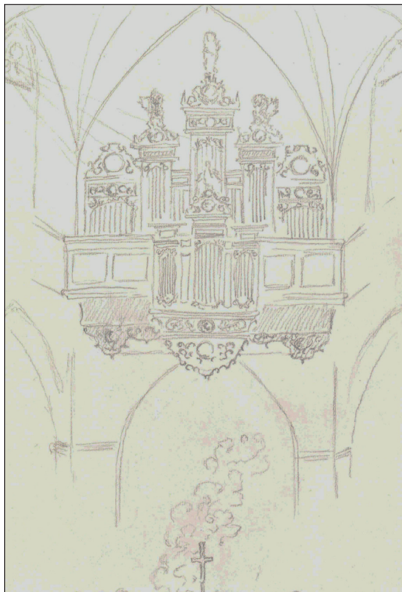
Ryc. 3. Rysunek Studentki 5

przez siebie dane na temat dziejów i znaczenia wybranych przedmiotów. Natomiast w jednym przypadku (tj. pracy Studenta 5) cały opis dzieła jest wynikiem wyobraźni, stanowi więc tekst o charakterze hipotezy, bez oparcia na źródłach i opracowaniach historycznych.