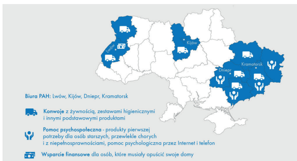
Mapa 1. Pomoc PAH dostarczona Ukrainie od dnia 24 lutego 2022 roku

Inną instytucją mającą duże zasługi w niesieniu pomocy uchodźcom i migrantom jest Caritas Polska . Skupia się ona na działaniach mających na celu integrację przybywających do kraju migrantów z resztą społeczeństwa poprzez organizowanie kursów językowych, wsparcie w poszukiwaniu pracy i mieszkania, zapewnianie ochrony socjalnej i bytowej czy pomocy psychologicznej.