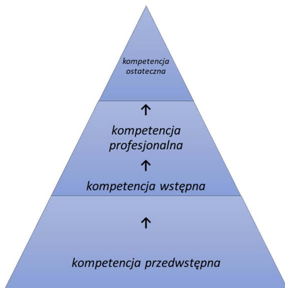
Schemat 1: Piramida ewolucji kompetencji nauczycielskich (źródło: opracowanie własne)

Można by zatem zadać również inne pytania: