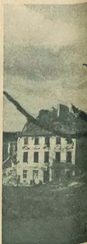
Ruiny i kwiaty Warszawy. Przez nagie konary wycięte.