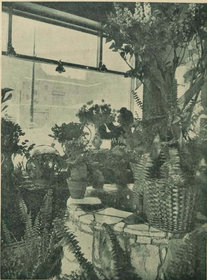
Ruiny i kwiaty Warszawy. Jedną z najlegantszych kwiatarni warszawskich. Świadczy, że dla Warszawy i Warszawaków kwiaty, mimo zniszczeń i ciężkich warunków życia — są nadal, jak i przed wojną, artykułem pierwszej potrzeby.