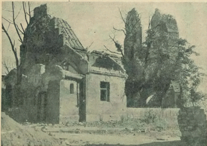
Ruiny i kwiaty Warszawy. Melonlice ruiny kościoła Panny Marii, wśród których napół uschnięte drzewa pokryty są wiosną 1945 r. świątą zielenią.