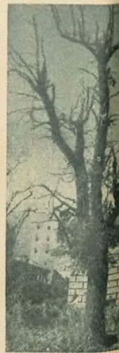
Ruiny i kwiaty Warszawy. Czas Powstania powstańca.