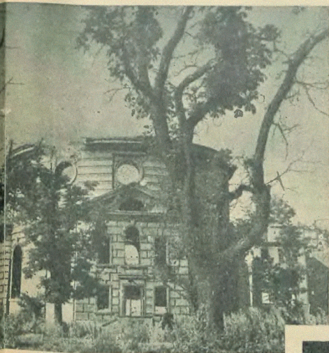
Ruiny Zboru Ewangelickiego. Drzewa rosnące wokół zostały podgaskodzone i częściowo uschły.