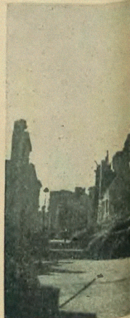
Ruiny i kwiaty Warszawy. Tymbardziej martwo wycięte.