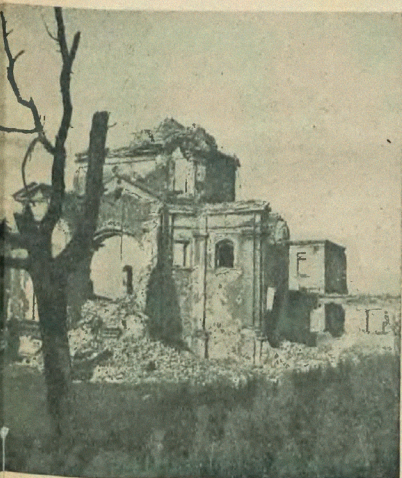
Ruiny kościoła PP Sakramentek na Nowym Mieście, widziane po skutku okaleczenia posiekami drzewa.