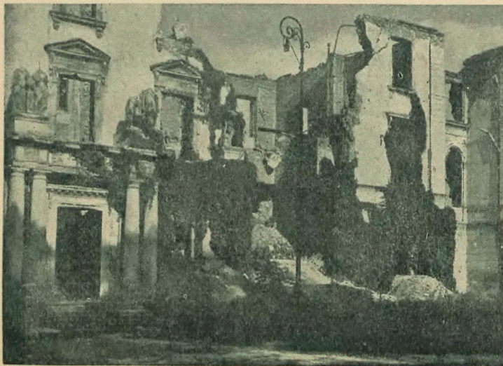
Ruiny i kwiaty Warszawy. Dzikie wino pokryło bujną zielenią zburzone budynki Uniwersytetu.