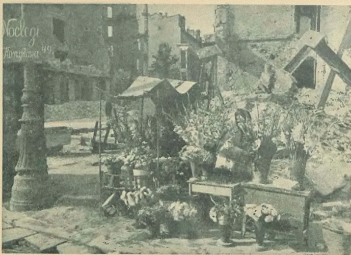
Ruiny i kwiaty Warszawy. Obok straganów z chlebem i zupek, jedne z pierwszych były w Warszawie — stragany z kwiatami.