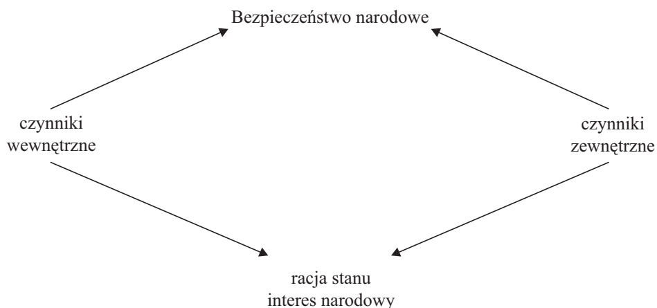
Rys. 2. Istota bezpieczeństwa narodowego (państwowego)

Bezpieczeństwo obejmuje obecnie bardzo szeroki zakres problemów, ponieważ uznaje się, że w interesie narodowym (racji stanu) mieści się głównie kształtowanie bezpieczeństwa państwa, a bezpieczeństwo umożliwia z kolei pełną swobodę realizacji interesów narodowych.