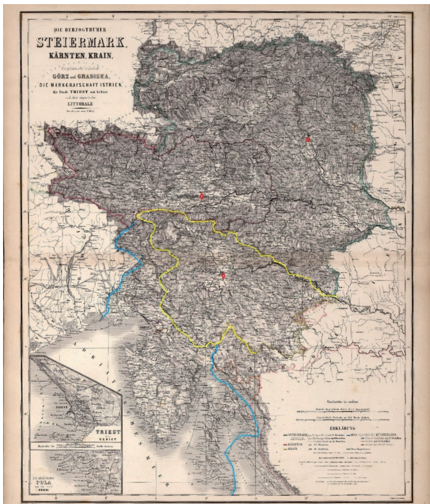
Ryc. 1. Die Herzogtümer , 1866.

i opublikowana w 1866 roku ( Die Herzogtümer , 1866). Wybrałem ją ze względu na to, że data jej wydania odpowiada mniej więcej publikacji mapy Kozlera, jednakże wyobrażenie graficzne na niej zawarte powiela typową reprezentację tego regionu. Mapa nosi tytuł Die Herzogtümer Steiermark, Kärnten, Krain, die gefürstete Grafschaft Görz und Gradiska ,