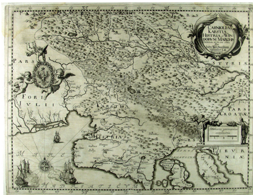
Ryc. 5. Austria Wewnętrzna wg Janeza Vajkarda Valvasora.

Podstawową funkcją mapy jest orientacja w przestrzeni i odwzorowanie relacji między punktami geograficznymi. Z map korzystali podróżnicy, Kościół (wyznaczając granice diecezji lub dóbr), władcy, kupcy, ale też geografowie – badacze świata. Trzeba jednakże pamiętać, że do drugiej połowy XIX stulecia mapa nie była w powszechnym użyciu. Jej przygotowanie i druk były dość kosztowne, techniki powielania również czasochłonne i drogie, nie można więc twierdzić, iżby w dawnych epokach ludzie mieli powszechnie wyobrażenie o wyglądzie świata, nawet