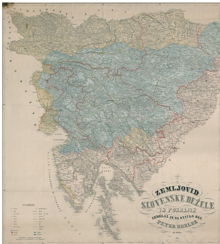
Ryc. 4. Zemljevid Slovenske dežele , 1871.

chciały się tego podjąć aż do końca istnienia państwa. Problemy wynikające ze zderzenia tych dwóch postaw prawnych, dwóch sposobów legitymizowania porządku polityczno-społecznego, dwóch koncepcji filozofii społecznej, bardzo dobrze ilustruje wydanie mapy Kozlera z 1871 roku, na którym ręcznie został pokolorowany obszar Prowincji Słoweńskiej (na kolor błękitny). Różnica wobec wydania pierwszego była znacząca. W 1853 roku kartograf zaznaczył jedynie linię obejmującą słoweński obszar etniczny, co było ogromną ingerencją w porządek prawno-polityczny, jednakże wizualnie ta ingerencja nie rysowała się aż tak dojmująco jak