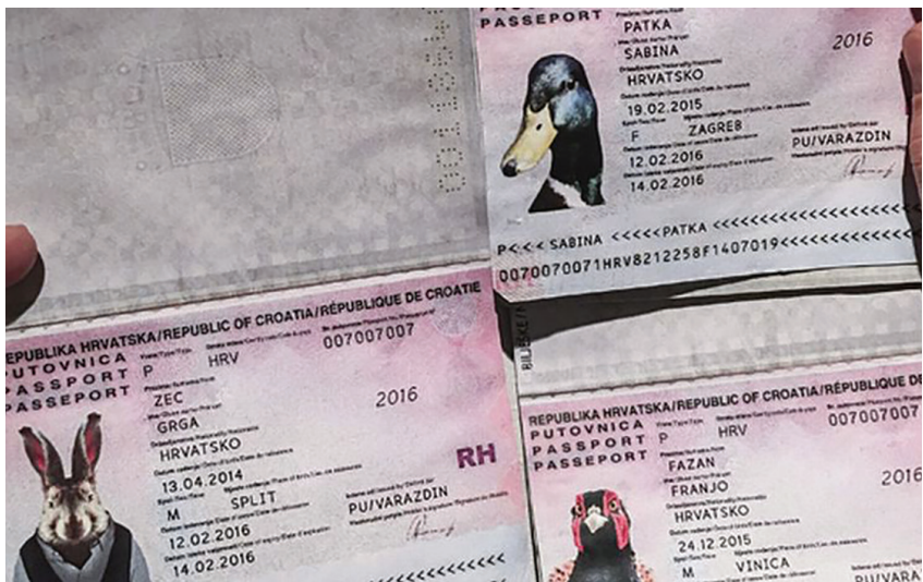
Fot. 3. Ivan Mesek i Zefry Throwell, Šumska koncertina , Varaždin 2016., kratki film