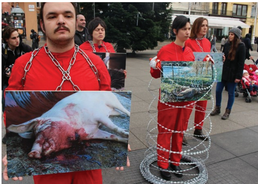
Fot. 2. Prijatelji životinja na Međunarodni dan prava životinja, 10. prosinca 2015. godine, akcijom privlačenja pažnje na glavnom zagrebačkom trgu ukazali su na smrtonosne zidove, ograde, kaveze i žice; prva reakcija u Hrvatskoj protiv žilet-žice i u ime životinja (cf. „Dan prava životinja...“, 2015, http ).

kojom se izvedbeno mogu razbiti svi spektakli ciničke moći – gdje se za njih mogu nabaviti i izraditi putovnice. Tada su izradili lažne dokumente za životinje i s njima došli na hrvatsko-slovensku granicu. Službenik je umjetnike vratio te su bili primorani pronaći adekvatno mjesto, udaljeno od žilet-žice, kako bi životinje pustili u prirodu. Od snimljenog materijala o toj akciji montirali su kratki film koji problematizira temu izbjeglica i zatvaranja granica, a film je prikazan, među ostalim, i na filmskom festivalu u Cannesu 2016. godine (cf. Franceschi, Mesek, 2018, 118–119).