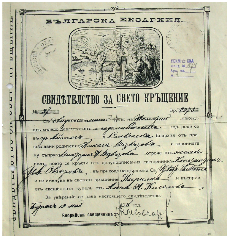
Фот. 1. Кръщелно свидетелство. НБКМ-БИА, ф. 854, а.е. 1, л. 1. Оригинал.