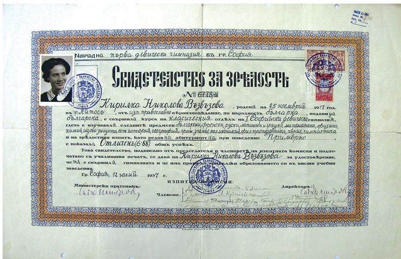
Фот. 2. Свидетелство за зрелост от Първа девическа гимназия – София (1937). НБКМ-БИА, ф. 854, а.е. 1, л. 7. Оригинал.