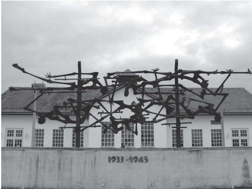
KZ-Gedenkstätte Dachau.