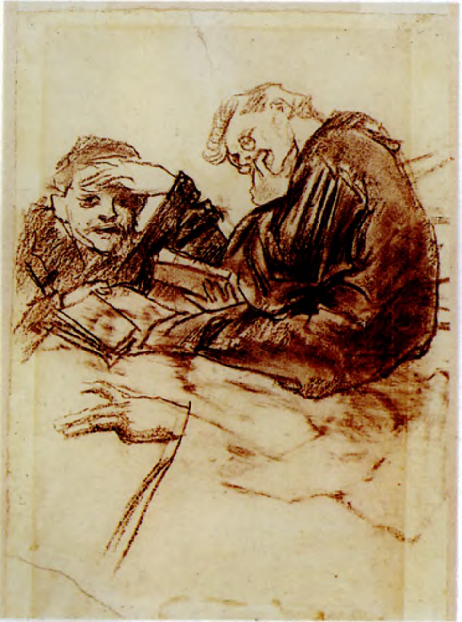
2. Stanisław Wyspiański, Portret zdwojony Józefa Mehoffera , 1981-1892 (?), Muzeum Narodowe w Krakowie