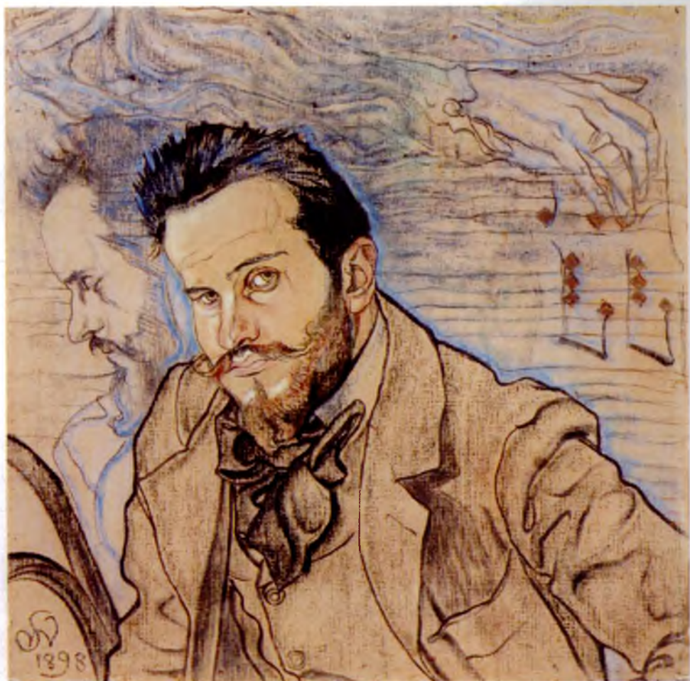
3. Stanisław Wyspiański, Portret Henryka Opieńskiego , 1898, Muzeum Narodowe w Szczecinie