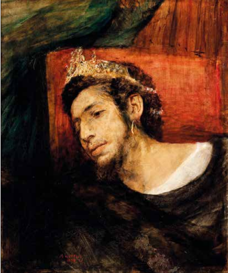
M. Gottlieb, Autoportret jako Ahasverus , 1876, Muzeum Narodowe Kraków

Juliusza Feldhorna, w którym postać wędrowca o „płomiennej głowie” zostaje osadzona we współczesnych konfliktach społecznych, na tle gwałtownego, lecz daremnego buntu robotników 8 .