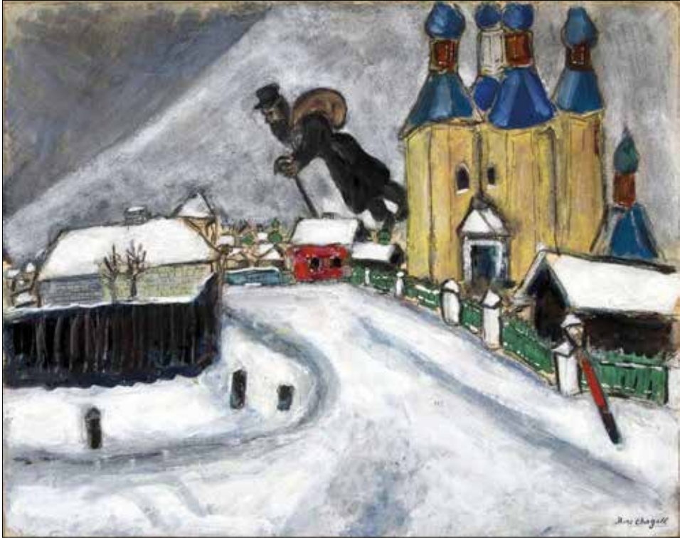
M. Chagall, Nad Witebskiem , 1914, Art Gallery of Ontario, Toronto

zbioru Lif's Handicap , 1891), którego tytułowy bohater, wystraszony perspektywą śmierci, wyrusza w podróż wokół świata, wysłuchawszy głosu deklarującego, że idąc z zachodu na wschód, zyska się dzień życia.