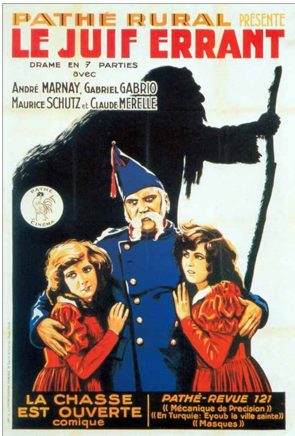
Plakat do Le juif errant Luitza-Morata (pseud. Maurice'a Louisa Radigueta), 1926