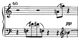
Przykład 3. A. Webern, Wariacje na fortepian op. 27, cz. III, t. 40. © Copyright by Universal Edition.