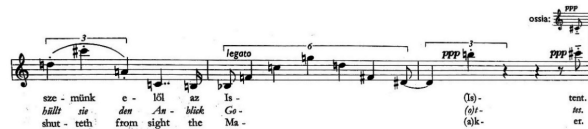
Przykład 5. G. Kurtág, Bornemissza Péter mondásai op. 7, część II „Grzech”. © Copyright by Universal Music Publishing Editio Musica Budapest. Reproduced by permission.