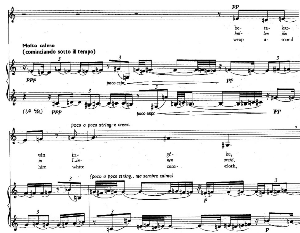
Przykład 6. G. Kurtág, Bornemissza Péter mondásai op. 7, część III. © Copyright by Universal Music Publishing Editio Musica Budapest. Reproduced by permission.