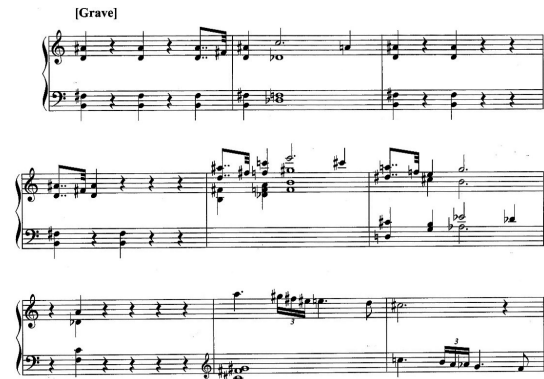
Przykład 1. G. Kurtág, Suita na fortepian (1943), część I, t. 1–9.

W słowach węgierskiego symbolisty Kurtág ujrzał dogłębne odbicie własnych przeżyć. Opisując swoją pierwszą kompozycję, dostrzegł jej główne cechy, quasi-Bartókovską harmonikę z typową dlań uporczywością: „ten sam akord jest tu grany w kółko. W żadnym wypadku nie jest to powtórzenie, lecz uderzenie serca, i następne uderzenie serca” 17 . Oprócz silnego przesłania, wiersz mógł zainspirować Węgra swoistą muzycznością, wewnętrznym, niemal dźwiękonaśladowniczym rytmem („stuk-stuk” na początku każdej strofy). Suita została opublikowana w oryginalnym kształcie dopiero w 2021 roku 18 , jednak wiele lat wcześniej kompozytor wykorzystał ją jako drugą część utworu pt. Six Moments Musicaux [Sześć momentów muzycznych] na kwartet smyczkowy op. 44 (1999–2005). W tym kształcie młodzieńcza kompozycja otrzymała tytuł Footfalls [Kroki], co wydaje się nawiązaniem do sztuki Samuela Becketta o tym samym tytule.