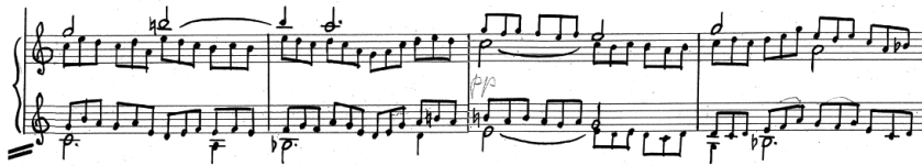
Przykład 10. A. Nikodemowicz, Tryptyk – Grudki kadziła IV , cz. III, t. 9–12, partia organów.