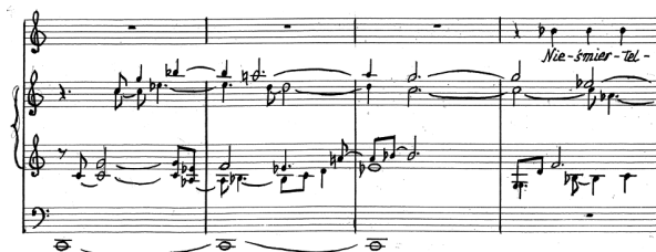
Przykład 3. A. Nikodemowicz, Tryptyk – Grudki kadzidla IV , cz. I, t. 17–20. Fragment rękopisu zamieszczony dzięki uprzejmości rodziny kompozytora.

W częściach B i B1 ( Nieśmiertelne przecie, w śmiertelnej klatce ciała pomnego dróg powrotnych strzec dałeś mi gołębia ) narracja ulega zmianie. Analogicznie do części A najpierw słychać organy solo, które powtarzają schemat harmoniczny otwierający część A, jednak ze zwiększoną ruchliwością poszczególnych głosów i charakterystyczną nutą pedałową c, która pojawia się także w dalszej narracji tej pieśni (por. Przykład 3).