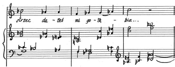
Przykład 5. A. Nikodemowicz, Tryptyk – Grudki kadzidla IV , cz. I, t. 29–31.

Zwrot ten jest jakby wyrazem nadziei, a jednocześnie stanowi zawieszenie narracji, sugerujące gotowość lirycznego ja do dalszej modlitwy. Podkreśla to także coda, kończąca się niejednoznacznym tonalnie akordem kwartowo–kwintowym, którego podstawą jest dźwięk c . Zastosowana w pieśni Jakże mnie ufność Twoja melodyka ugruntowuje słuchacza w poczuciu silnego związku partii solowej z twórczością chorałową, z jednej strony surową, nastawioną na podkreślenie prozodycznych właściwości tekstu, z drugiej jednak podatną na jego niuanse semantyczne – w tym przypadku podkreślenie śmiertelności podmiotu i jego modlitewnej intencji – za chwilę bowiem podmiot zwróci się bezpośrednio do Boga.