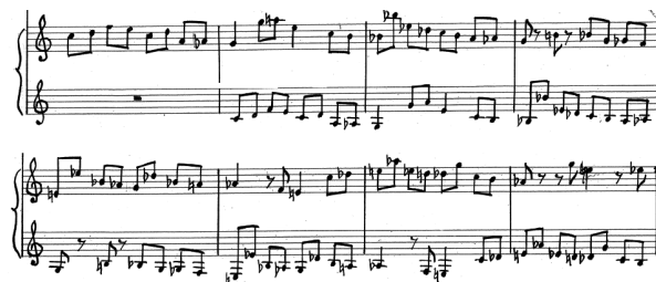
Przykład 6. A. Nikodemowicz, Tryptyk – Grudki kadzidla IV , cz. II, t. 1–8, partia organów. Fragment rękopisu zamieszczony dzięki uprzejmości rodziny kompozytora.

Zgodnie z założeniem tryptyku ogniwo środkowe – Posyp nam serca miłością – kontrastuje z otwierającą tryptyk pieśnią. Już sam incipit tego utworu świadczy o tym, że w centrum tryptyku umieszczona została modlitwa, co sugeruje odbiorcy jej kluczową rolę w życiu człowieka. Wspomniany kontrast jest dla słuchacza czytelny już od pierwszego taktu. W partii organów wprowadzony zostaje bowiem temat, który następnie, z opóźnieniem jednego taktu, jest w interwale oktawy imitowany przez drugi z akompaniujących głosów (por. Przykład 6).