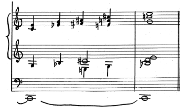
Przykład 12. A. Nikodemowicz, Tryptyk – Grudki kadziła IV , cz. III, t. 24–25.

to, że materiał brzmieniowy wydaje się słuchaczowi bardziej rozświetlony, skontrastowany z tajemniczym nastrojem pieśni otwierającej cykl. Dopiero coda wykorzystuje skalę chromatyczną i zmierza do zakończenia pieśni wyraźnym (podkreślonym nutą pedałową) akordem C-dur septymowo-nonowym (por. Przykład 12).