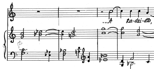
Przykład 9. A. Nikodemowicz, Tryptyk – Grudki kadzidla IV , cz. III, t. 1–4. Fragment rękopisu zamieszczony dzięki uprzejmości rodziny kompozytora.

Wraz z rozpoczęciem pieśni trzeciej – A kadzidło... – wraca nawiązanie do organum i motyw czołowy z pierwszej pieśni, przy czym współbrzmienia kwinty zastąpione zostały współbrzmieniami kwarty. Inwersji ulega także interwał początkowy partii mezzosopranu (tym razem jest to tercja mała w dół; por. Przykład 9).