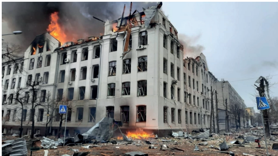
Zdjęcie 3. Gmach Wydziału Ekonomicznego Charkowskiego Uniwersytetu Narodowego im. W. Karazina po rosyjskim ataku raketowym 2 marca 2022 roku

możliwości zdobywania wiedzy i niezbędnych umiejętności w dowolnym czasie i miejscu (głównie dzięki technologiom informatycznym i heroicznej pracy każdego pracownika) 13 .