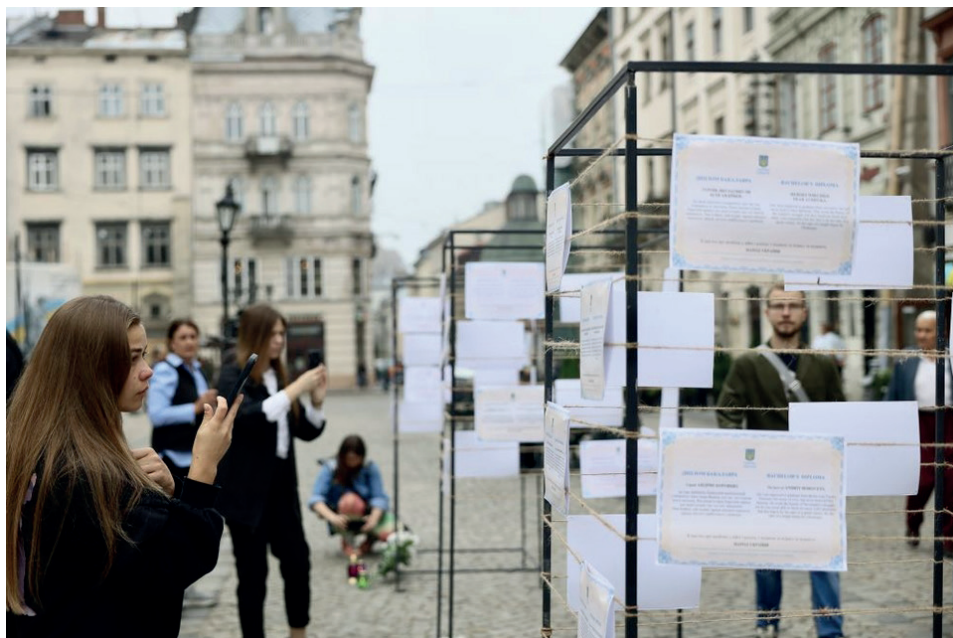
Zdjęcie 2. Akcja społeczna „Dyplomy, których nigdy nie wydamy” – uhonorowanie studentów z całej Ukrainy, którzy zginęli w walce z Rosją o niepodległość Ukrainy, 12 sierpnia 2022 roku