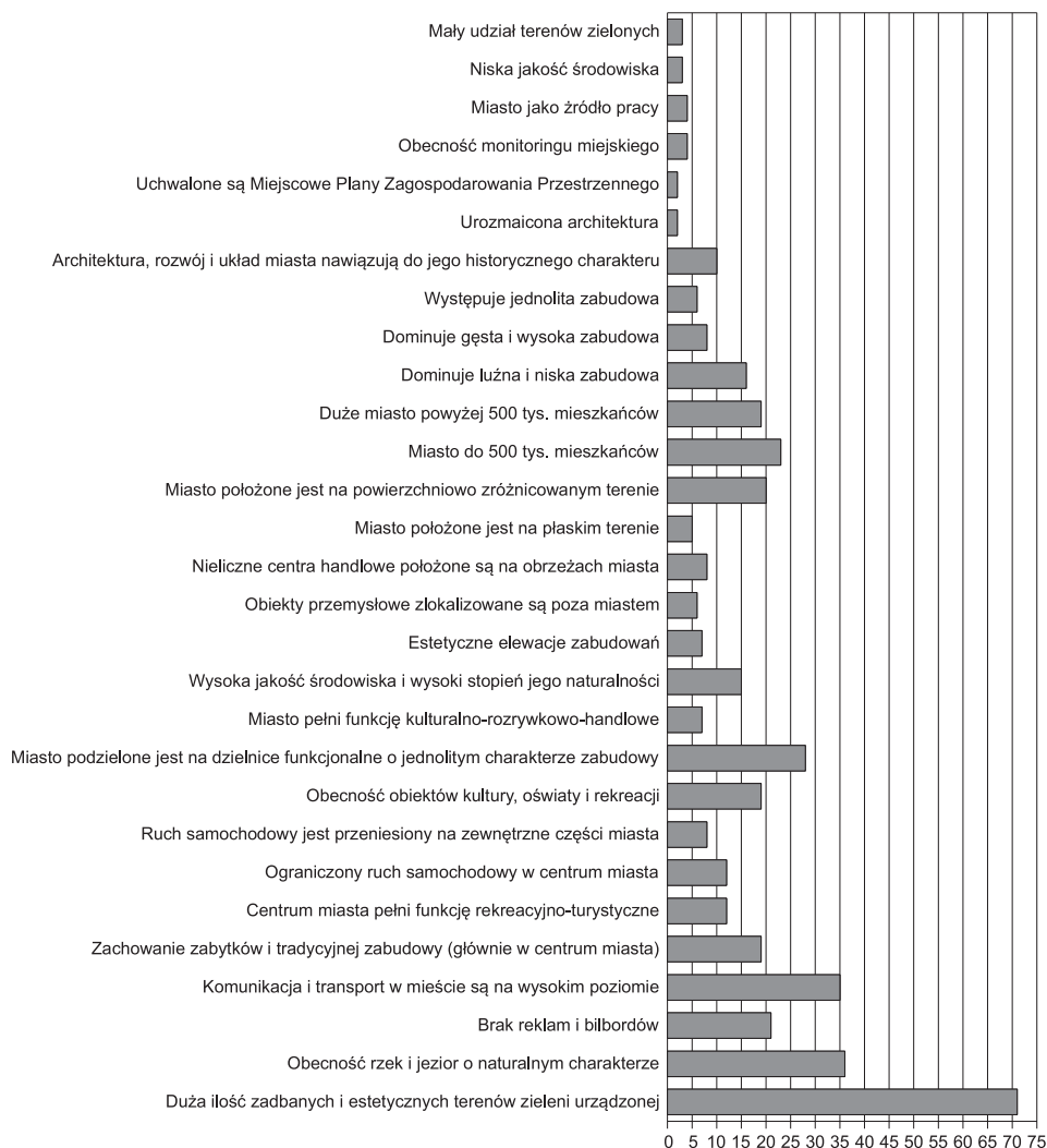
Ryc. 2. Cechy krajobrazu miasta „idealnego”