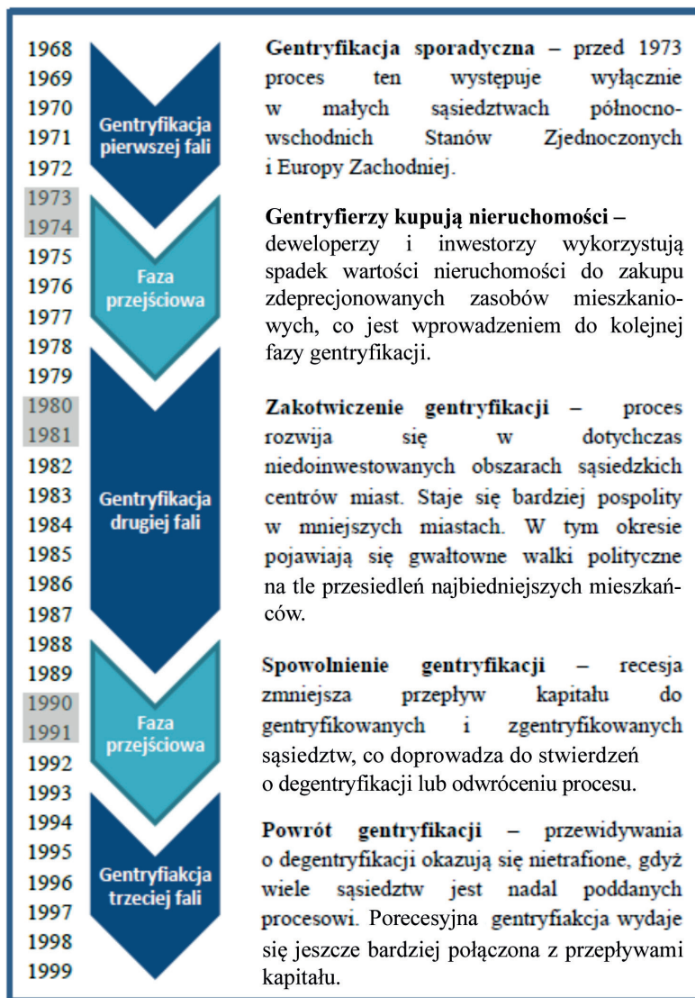
Ryc. 1. Schematyczne przedstawienie historii procesu gentryfikacji (szarym oznaczono okresy recesji)