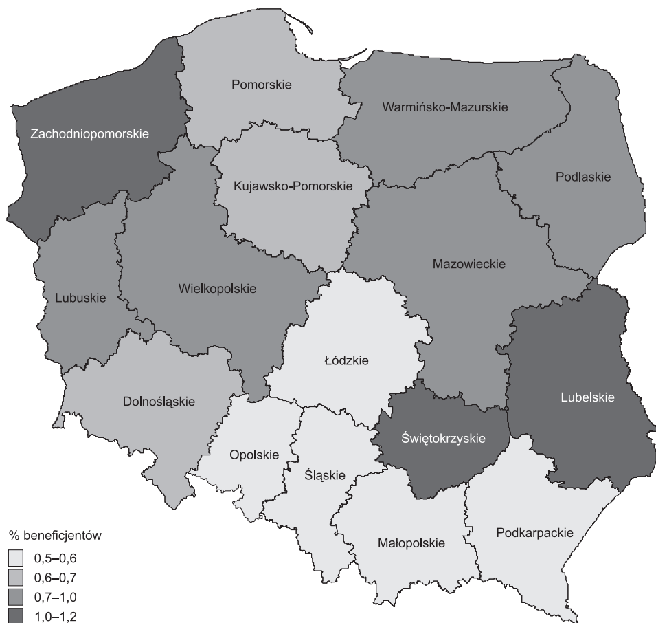
Ryc. 4. Natężenie alkoholizmu na wsi jako przyczyny przyznania pomocy społecznej w 2009 r.

W przypadku ubóstwa wskaźnik ten wykazuje dość duże zróżnicowanie regionalne, ale rozkład jest silnie skorelowany z odsetkiem osób objętych pomocą. Ubóstwo jest bowiem główną przyczyną otrzymania pomocy. Podobnie przedstawia się obraz przyznania pomocy z powodu bezrobocia.