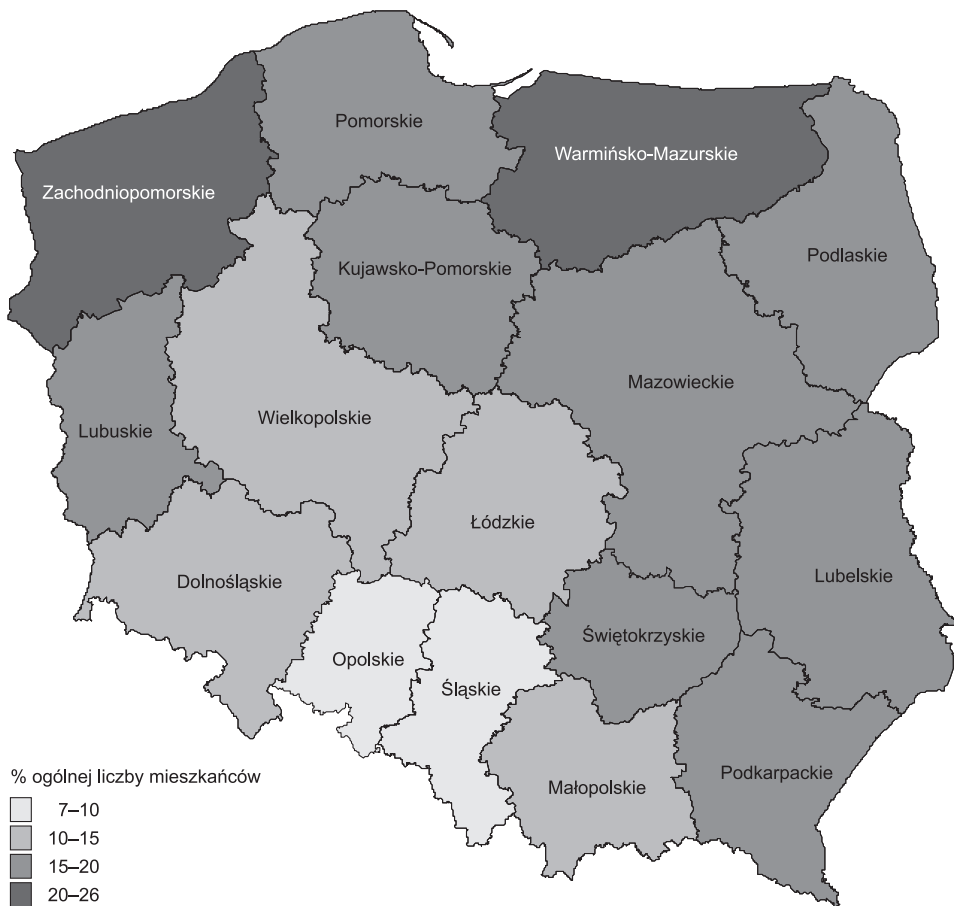
Ryc. 2. Skala pomocy społecznej na obszarach wiejskich w Polsce w 2009 r.

Zróżnicowanie regionalne zasięgu pomocy społecznej na obszarach wiejskich przedstawiono na rycinie 2.