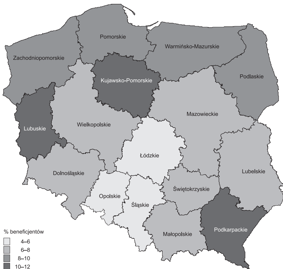
Ryc. 3. Natężenie biedy na obszarach wiejskich jako przyczyny przyznania pomocy społecznej w 2009 r.

Potwierdza to analiza zróżnicowania regionalnego powodów przyznania świadczeń (ryc. 3, 4).