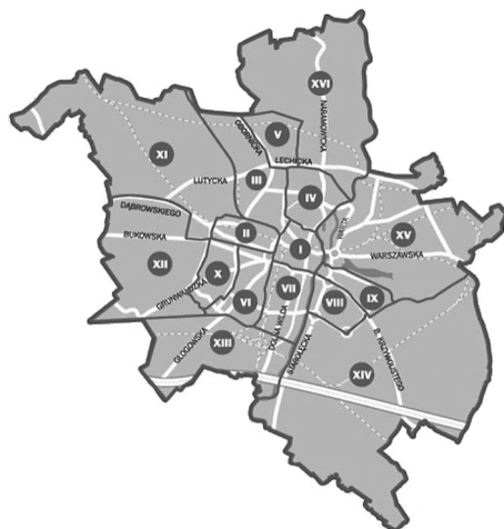
Ryc. 2. Podział administracyjny Poznania proponowany przez prezydenta miasta (wariant z 2008 r.)