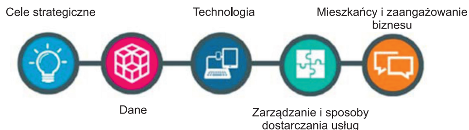
Ryc. 2. Wymiary modelu dojrzałości miasta inteligentnego

Jak pisze Manual (2012), w sektorze nauki, ICT umożliwia programy edukacyjne online oraz platformy e-learningowe. Od dawna, technologie te uważane są za ważne narzędzie prowadzące do poprawy rezultatów procesu kształcenia,