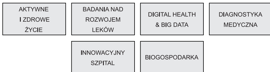
Ryc. 3. Grupy zadaniowe parku naukowo-technologicznego Life Science Kraków

Szczegółowy wykaz partnerów klastra jest dostępny na stronie https://lifescience.pl/czlonkowie-klustra/ (dostęp: 24.05.2019). Organem doradczym inicjującym kierunki działalności klastra, opiniującym realizację projektów i powołującym grupy zadaniowe jest Rada Programowa. Te ostatnie odpowiadają kierunkom rozwoju sprecyzowanym w Inteligentnej Specjalizacji Nauki o Życiu 7 (ryc. 3).