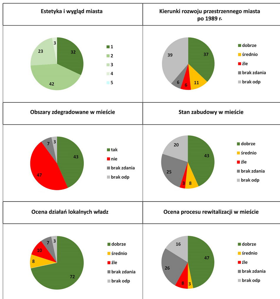
Ryc. 2. Struktura procentowa odpowiedzi respondentów na temat oceny procesów przestrzennych i rewitalizacji badanych miast

przyznało 40% badanych, średnią 11%, a złą 6%. Pozostałe osoby nie miały zdania bądź nie potrafiły udzielić odpowiedzi, gdyż w większości wypadków nie zastanawiały się wcześniej nad tym zagadnieniem. Postawione pytanie często było zaskoczeniem. Najlepsze oceny przyznano w Działdowie i Mrągowie (po 50% badanych), a także w Giżycku i Piszcu (40%). Dobre oceny wiązały się z ogólną pozytywną oceną rozwoju przestrzennego i funkcjonalnego miast, rozwojem dostępności komunikacyjnej, zaprzestaniem budowy osiedli blokowych okresu socjalizmu. Co nie dziwi, w miastach bardzo zniszczonych i przebudowanych ocena rozwoju przestrzennego wypadła najslabiej (30% głosów krytycznych