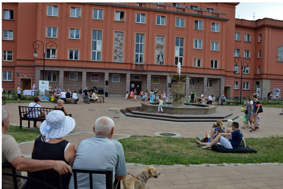
Fot. 1. Zrewitalizowany plac św. Anny w Tychach podczas jednego z lokalnych wydarzeń (czerwiec 2017 r., fot. Krzysztof Bierwiazonek)