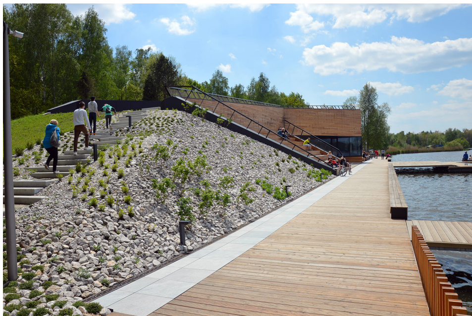
Fot. 3. Nowa przystań kajakowa nad Jeziorem Paprocańskim w Tychach (maj 2020 r.)

jest projekt (aktualnie w początkowej fazie realizacji) centrum Dąbrowy Górniczej na terenie dawnej fabryki obrabiarek „Defum”. Zakłada on korzystanie z odnawialnych źródeł energii, przyjmuje założenia miasta „gąbki”, stworzenie łąk kwiatnych, minimalizowanie ruchu samochodowego, a także powstanie zielonego rynku ( fabrykapelnazycia.eu ). Można jedynie mieć nadzieję, że ambitne założenia projektowe zostaną zrealizowane. Działaniami wpisującymi się, choć w mikroskali, w proces zrównoważonego rozwoju, ale też kreowania terenów zielonych, jest tworzenie w miastach ogrodów społecznych (por. Barszczewska-Woszczyk 2020) czy miejskich pasiek.