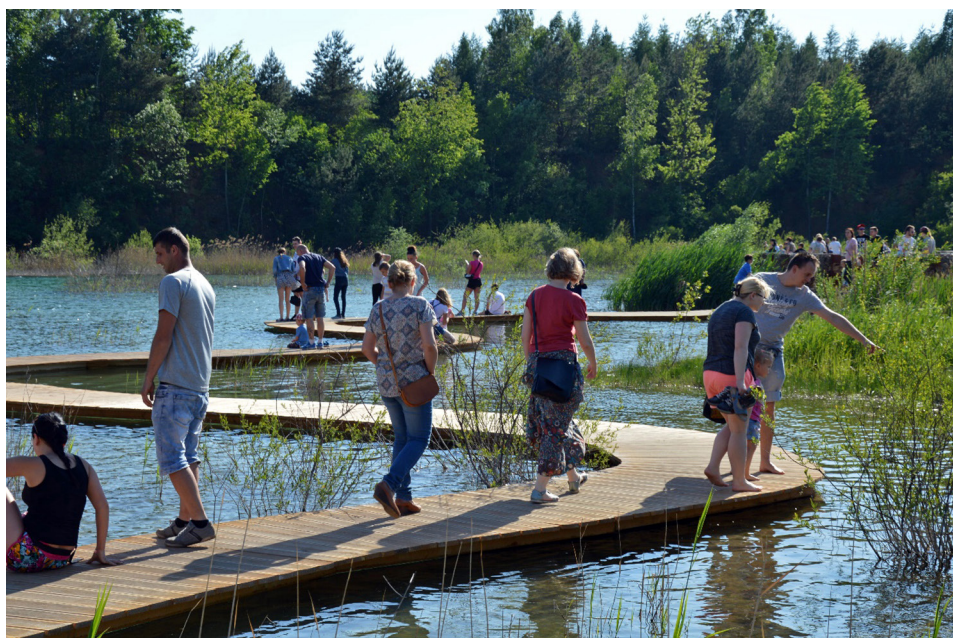
Fot. 2. Park Gródek w Jaworznie (maj 2018 r.)