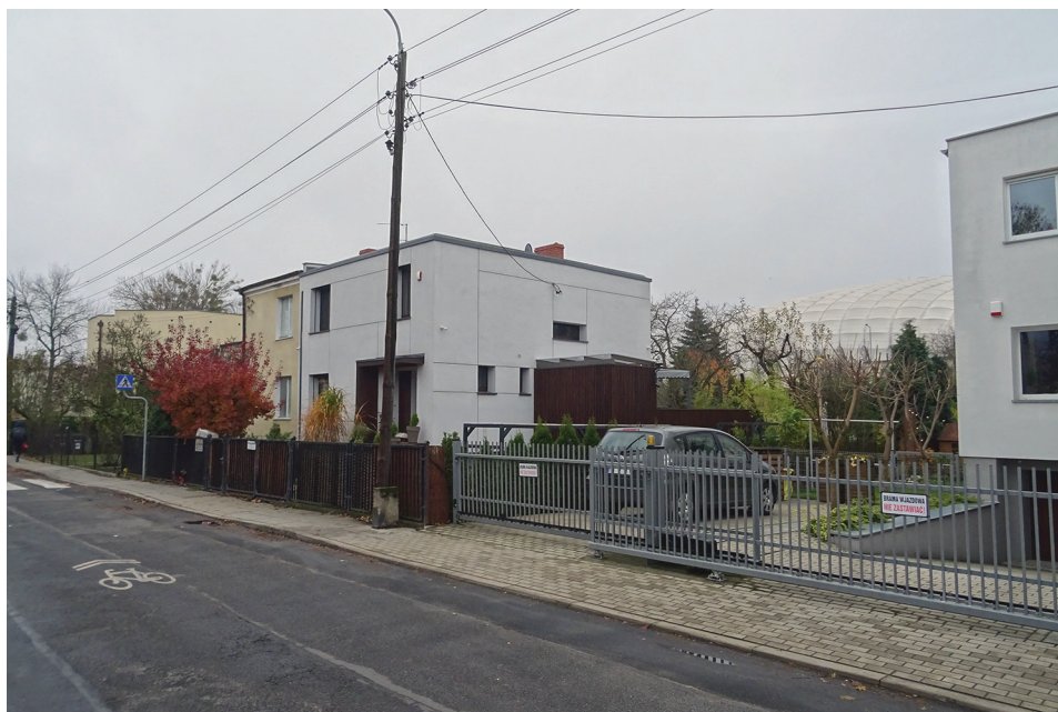
Ryc. 5. Kuszewo, ul. Trybunałska, w oddali Stadion Miejski (9 listopada 2021 r.)

obejmuje fragmenty ulic: Kanclerskiej, Senatorskiej i Podkomorskiej, pomiędzy skrzyżowaniami z Marszałkowską i Cześnikowską, a także zachodnią stroną ul. Podstolińskiej. Kuszewo (ryc. 5) obejmuje swoim zasięgiem przede wszystkim ul. Kasztelańską od Drzewieckiego do Bułgarskiej, Trybunałską oraz współtworzącą Abisynię część ul. Bułgarskiej. Wskazany wyżej podział Abisynii ma charakter przybliżony – niekiedy wśród działek zabudowanych w sposób charakterystyczny dla danego okresu zdarzają się obiekty przynależące do innego czasu zabudowy.