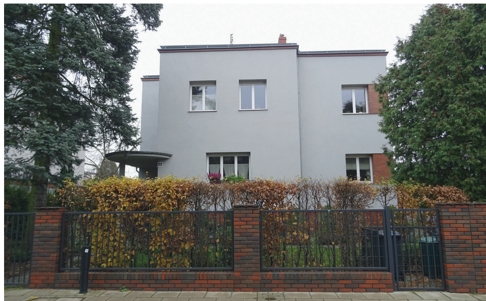
Ryc. 2. Międzywojenna zabudowa Abisynii, ulica Podkomorska (9 listopada 2021 r.)

Międzywojenna zabudowa Abisynii (ryc. 2, 3) koncentruje się wokół ulic: Kancelerskiej, Senatorskiej i Podkomorskiej, pomiędzy ich skrzyżowaniami z Marszałkowską i Kasztelańską, ul. Kasztelańskiej pomiędzy Marszałkowską a Drzewieckiego oraz przynależnej do Abisynii części ul. Grunwaldzkiej. Mądralin (ryc. 4)