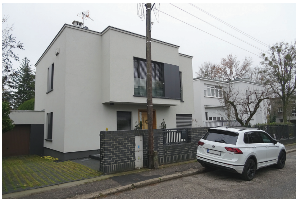
Ryc. 4. Mądralin, ul. Podkomorska (9 listopada 2021 r.)