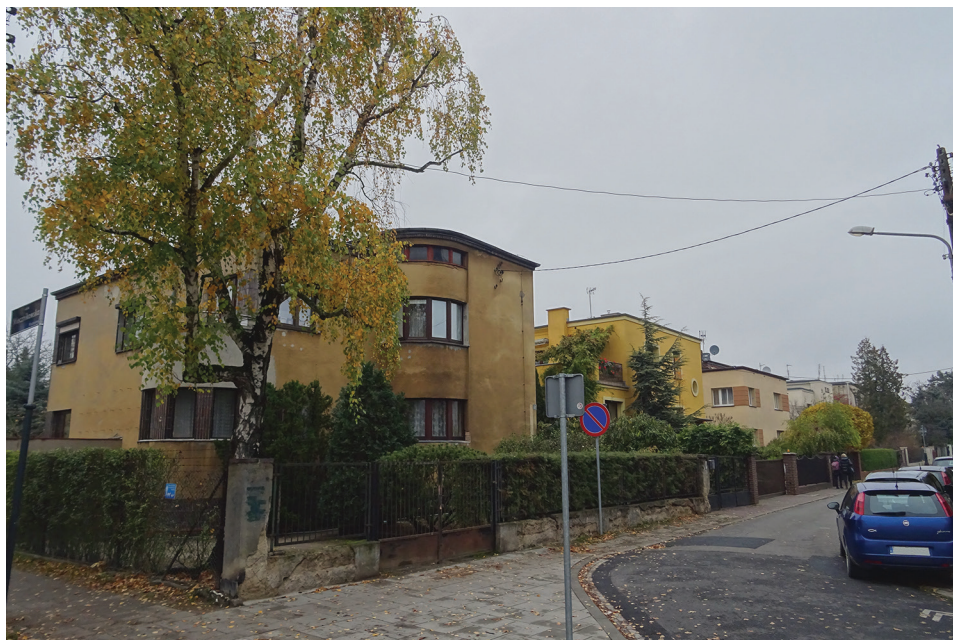
Ryc. 3. Międzywojenna zabudowa Abisynii, ul. Kanclerska (9 listopada 2021 r.)